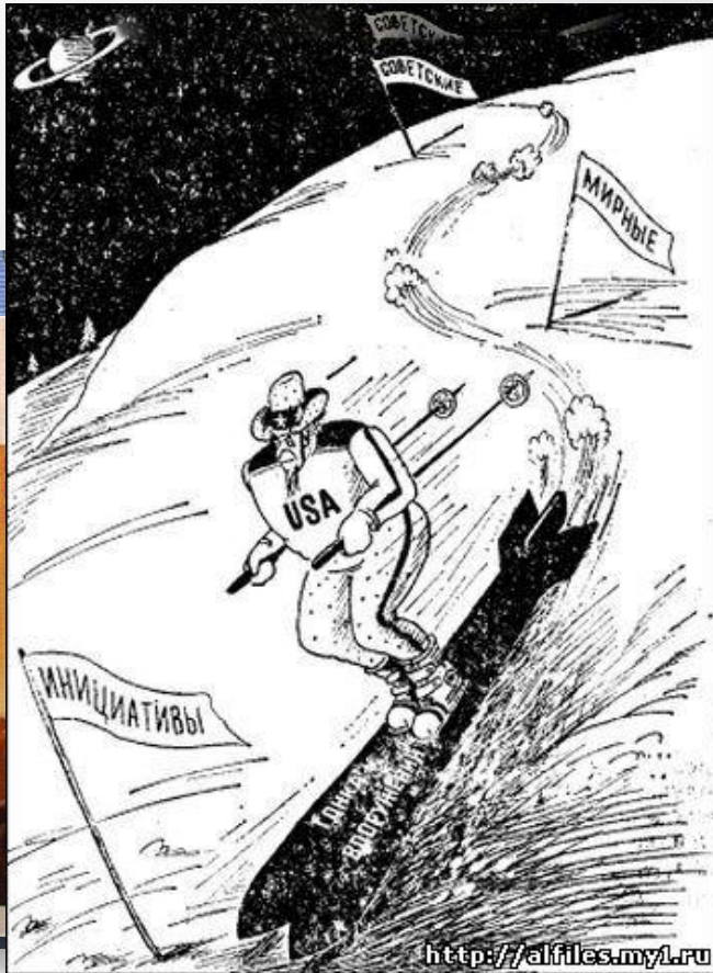
Карикатуры на США