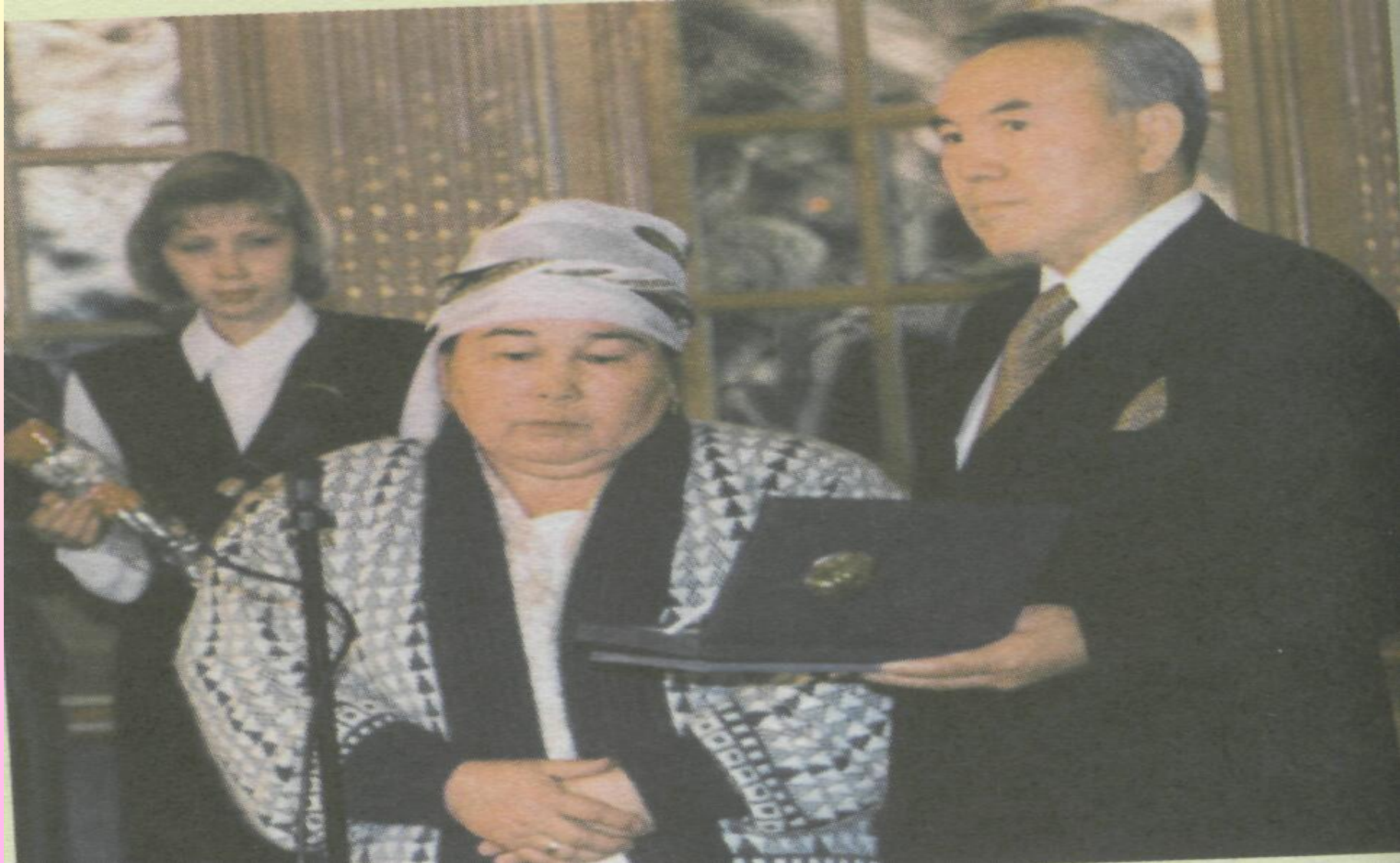
Елбасы Нұрсұлтан Назарбаев Қайрат Рысқұлбековтың анасына халық қаһарманы белгісін тапсыруда