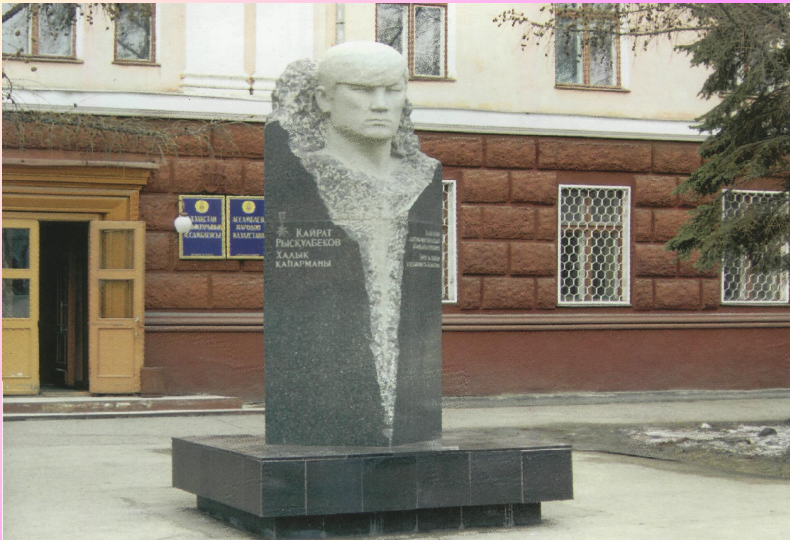
Халық қаһарманы Қайрат Рысқұлбековке орнатылған ескерткіш. Семей.