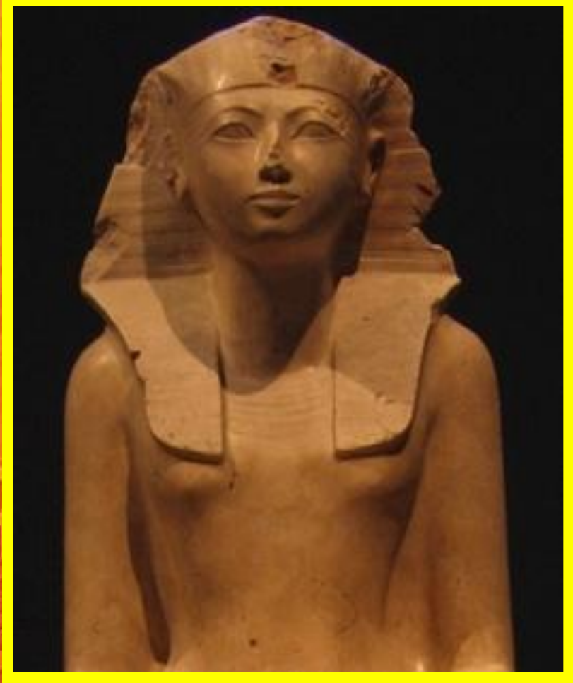
Известняковая скульптура Хатшепсут .

Хатшепсут, первая женщина-фараон Древнего Египта. При Хатшепсут Египет процветал в экономическом плане. Устанавливались рабовладельческие отношения, велась активная торговля.