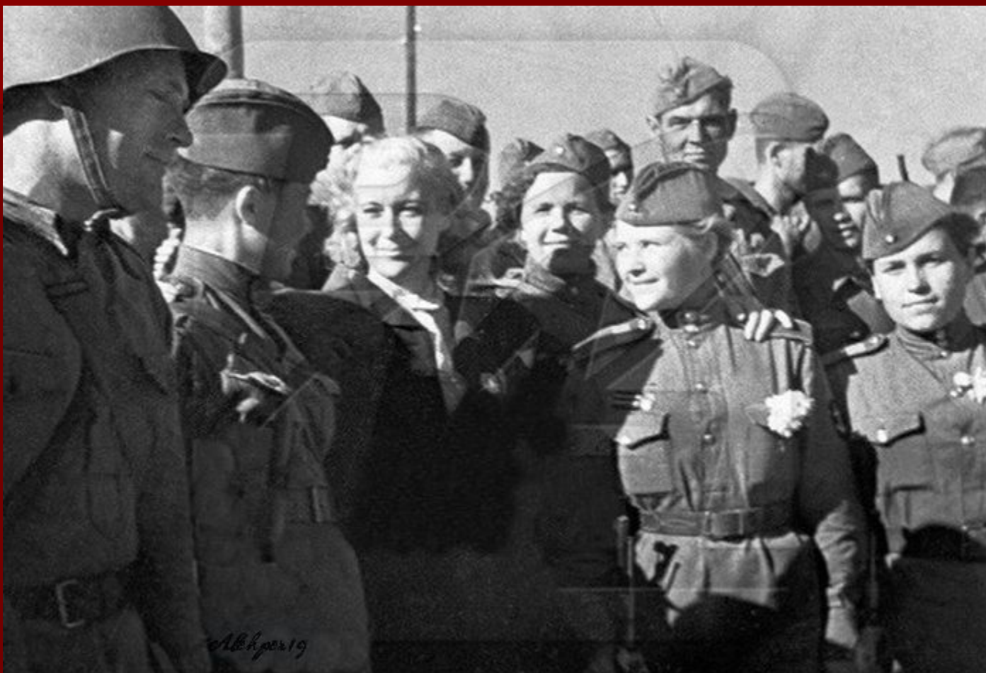
Любовь Орлова провожает воинов на фронт