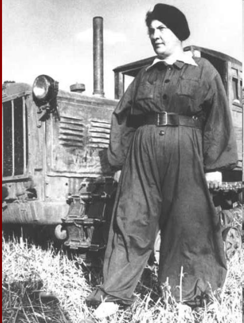
Прасковья Никитична Ангелина (Паша Ангелина)