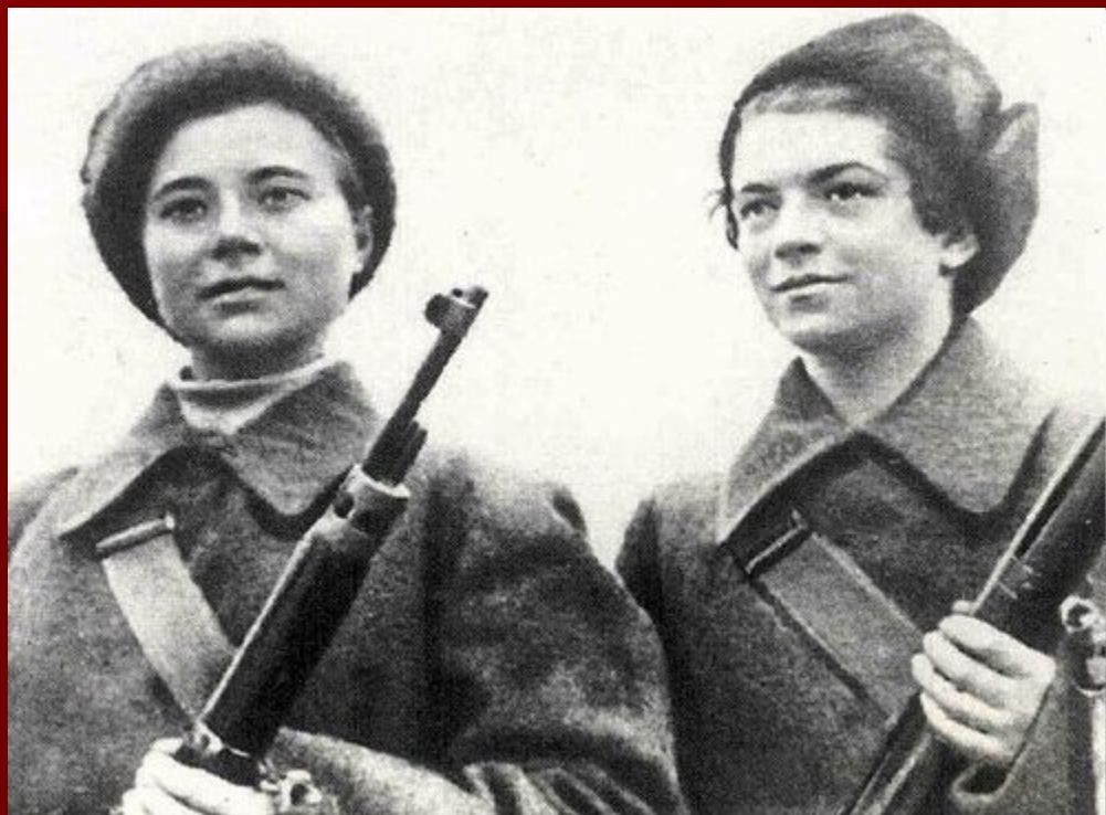
Наташа Ковшова и Мария Поливанова