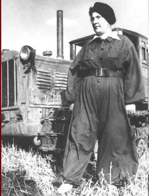
Прасковья Никитична Ангелина (Паша Ангелина)