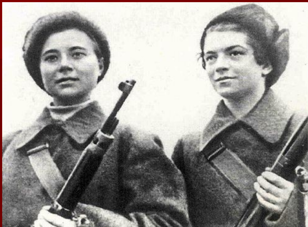
Наташа Ковшова и Мария Поливанова