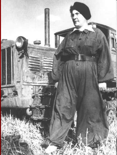
Прасковья Никитична Ангелина (Паша Ангелина)