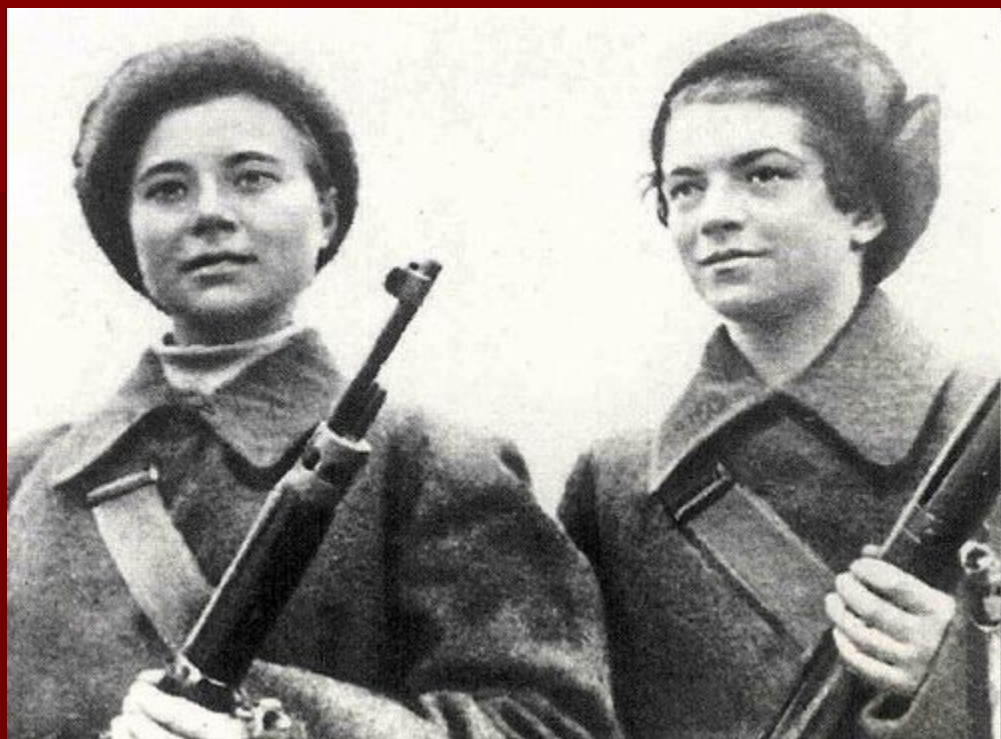
Наташа Ковшова и Мария Поливанова