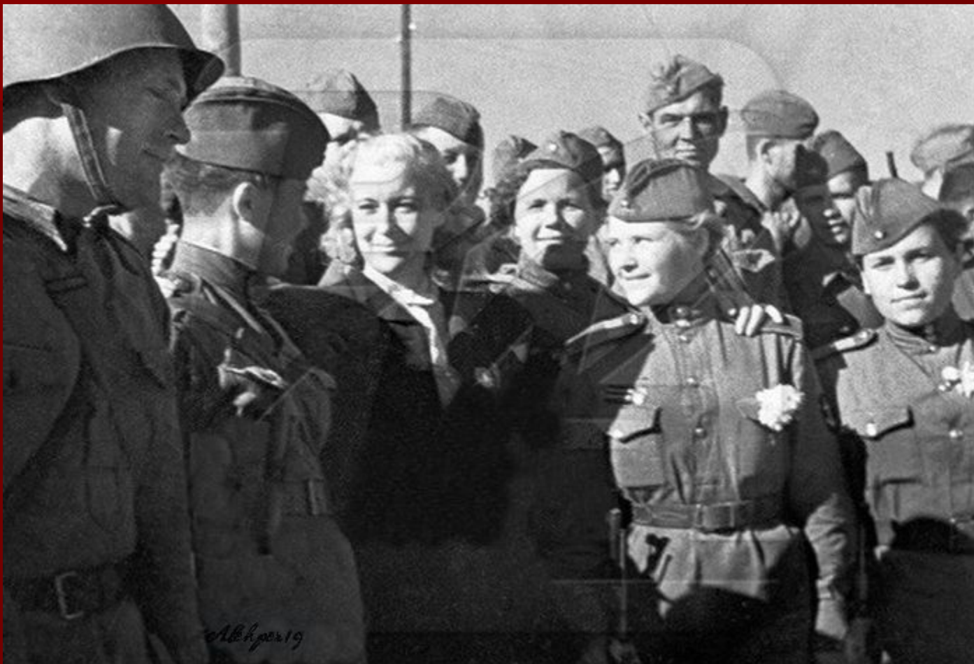
Любовь Орлова провожает воинов на фронт