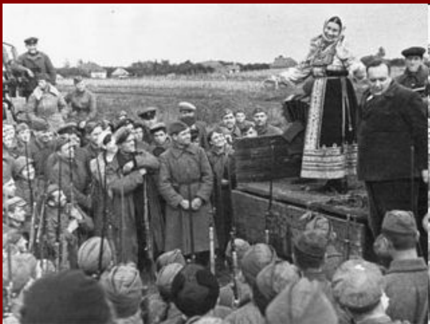
Выступление Лидии Руслановой