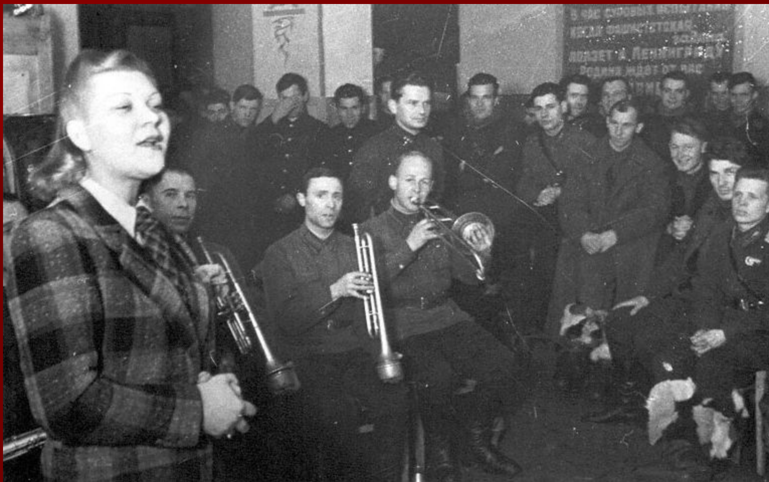
Выступление Клавдии Шульженко перед бойцами Н-ской части 1941 г