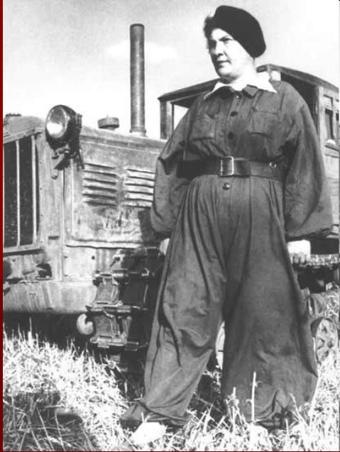
Прасковья Никитична Ангелина (Паша Ангелина)