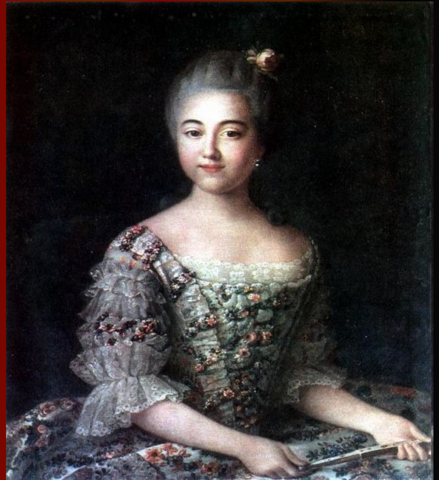
И.Аргунов Портрет Шереметьевой В.П.