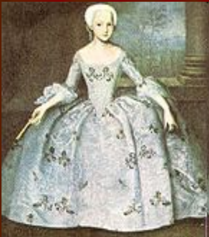
А. Вишняков Портрет Сарры Элеоноры Фермор

Основным силуэтом женского костюма второй половины XVIII в., за исключением последнего его десятилетия, был приталенный силуэт, сильно расширяющийся к бедрам и низу. Его создавали плотно облегающий по линии плеч, груди и талии лиф с глубоким декольте и широкая каркасная юбка — панье, позднее фижмы.