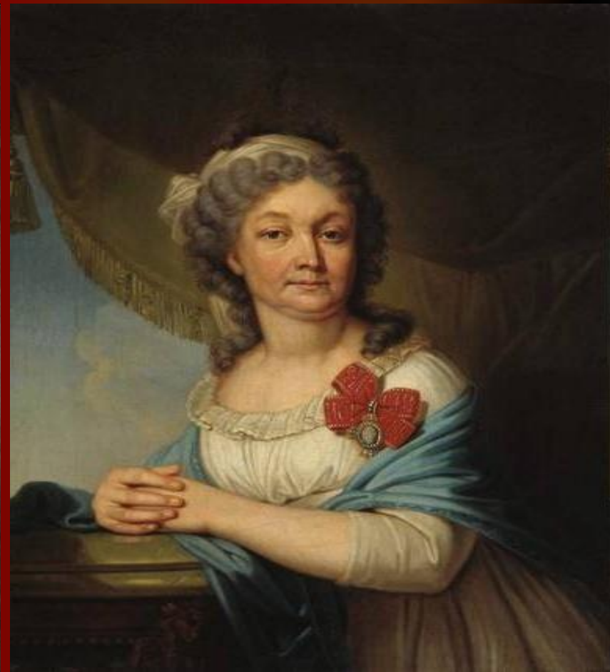
В. Боровиковский Портрет А.С. Васильевой