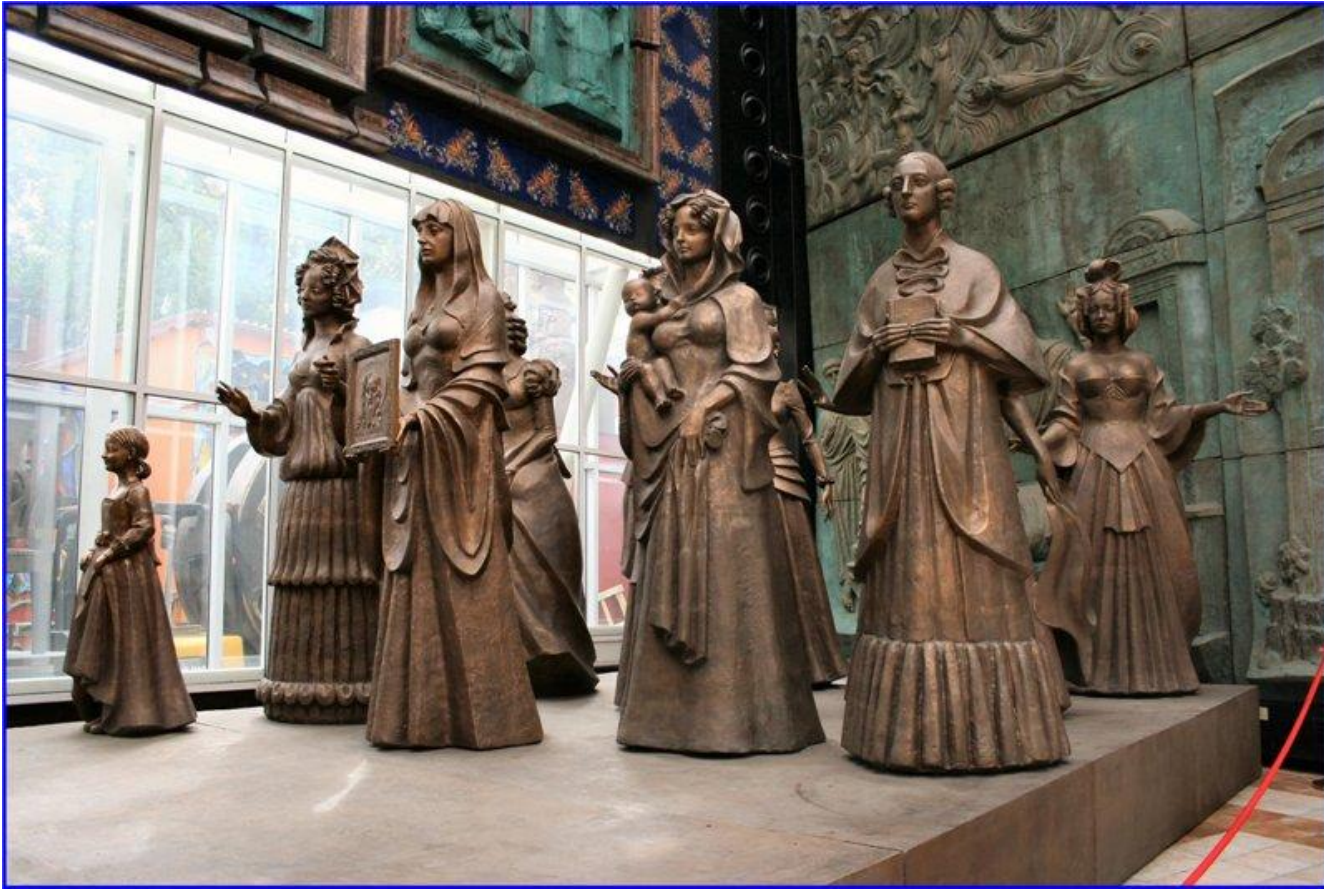
Зураб Церетели, скульптурная композиция "Жены декабристов. Врата судьбы"

Жены декабристов разделили участь своих мужей, совершив своеобразный женский подвиг. У каждой из них судьбы по-своему счастливы и трагичны. Каждой нелегко было оставить свою жизнь, иногда и детей, чтобы уехать за мужем.