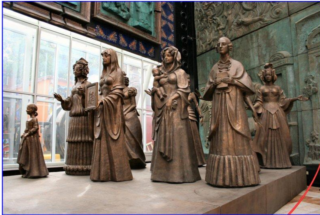
Зураб Церетели, скульптурная композиция "Жены декабристов. Врата судьбы"

Жены декабристов разделили участь своих мужей, совершив своеобразный женский подвиг. У каждой из них судьбы по-своему счастливы и трагичны. Каждой нелегко было оставить свою жизнь, иногда и детей, чтобы уехать за мужем.