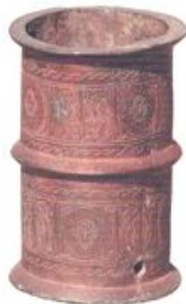
Қызыл жасалған сүт ... ағылғы айнада. XII – XIII ғ. Талхир