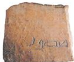
Арабша жазу бар құмырадан шыққан. Керемек. XII ғ. Талхир