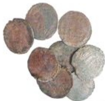
Ақшалар. Күзгіс, мнс. XI – XII ғ. Талхир