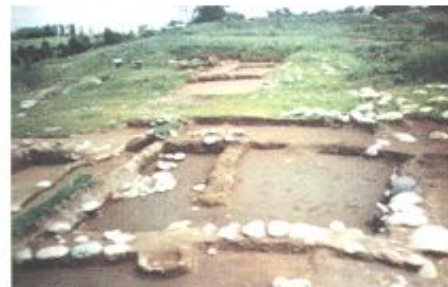
Талғар қаласының орны