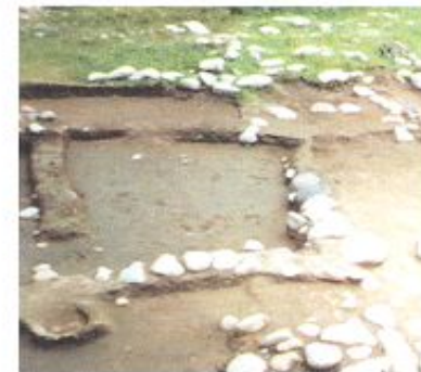
Үй-жайдың ірестесі, Талғар