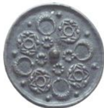
Иран айнасы. XII – XIII ғ. Талхир