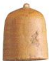
Үндінің шахмат фигурасы. XI – XII ғ. Талхир