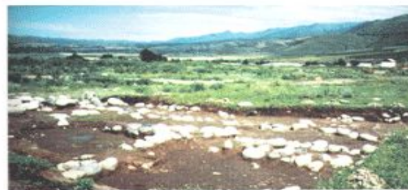
Түрлі қорғандар, Талғар. Қада жұмыстары кезінде