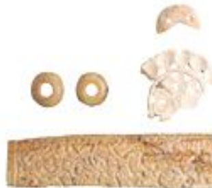
Сүтқорытқан қашақ жасалған әр түрлі пішіндегі бұйымдар. X – XII ғ. Талхир