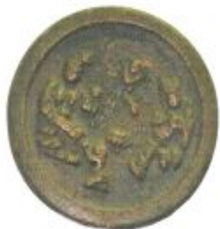
Қола айна. XII ғ. Талхир. Қытайда жасалған