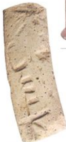
Жазу бар сәбе құмырадан шыққан. Керемек. XII ғ. Талхир