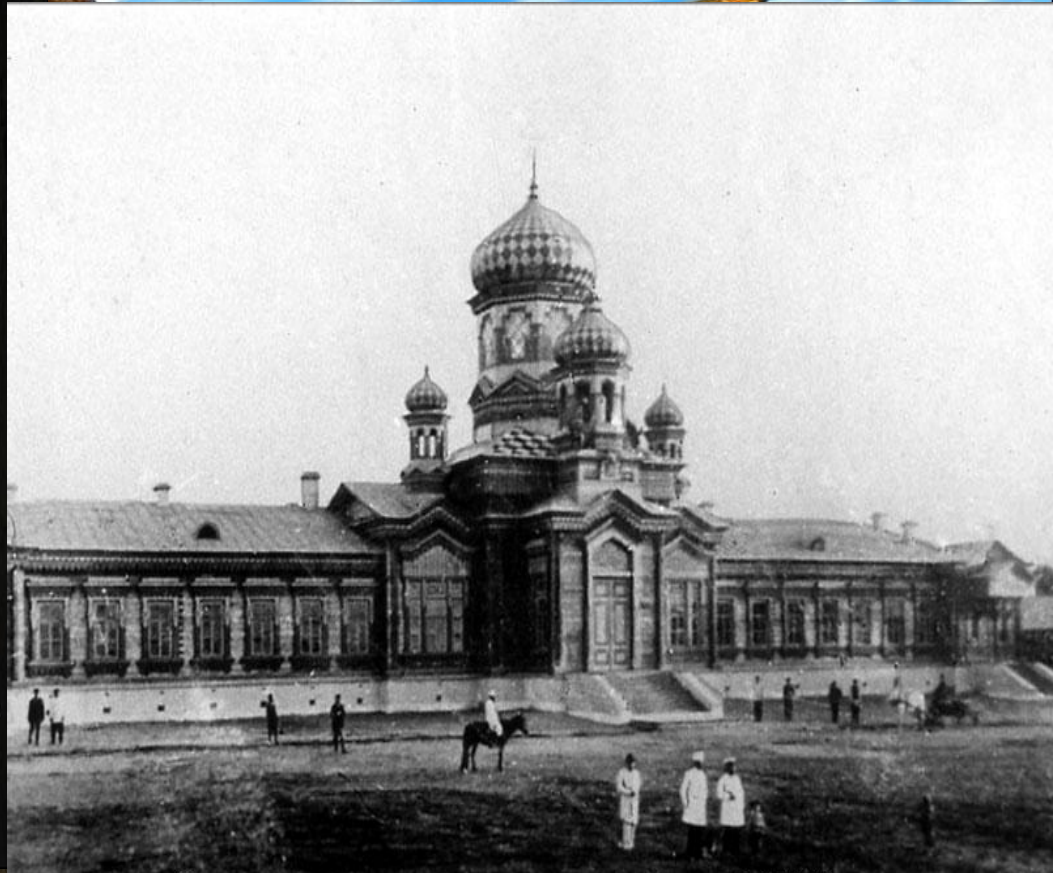
Здание детского приюта. 1892 год