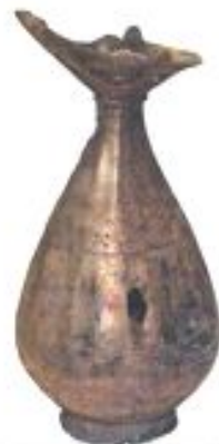
Ирандық сәбе құмыра. XII – XIII ғ. Талхир