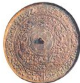
Жапон айналары арабша жазу және сәбе құмыра сәтін бейнелеген ирандық қола айна. XII – XIII ғ. Талхир