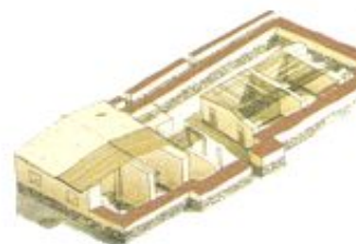
Үй-жай, XI - XIII ғ. Талғар