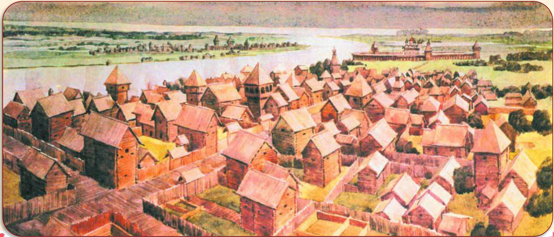
Новгород в XI в. Реконструкция Г. Борисевича

Повышенный уровень. С помощью учебника перечисли доказательства развития ремесла и торговли на Руси в XI веке.