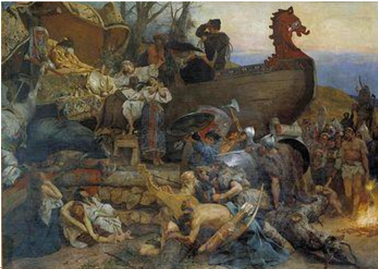
Г. Семирадский «Похороны знатного руса»