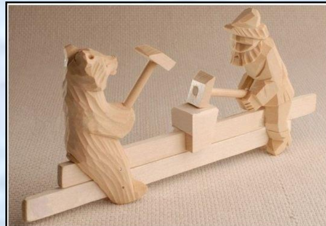
Богородская игрушка "Кузнецы".

Легенда о Богородских Легенда о Богородских игрушках