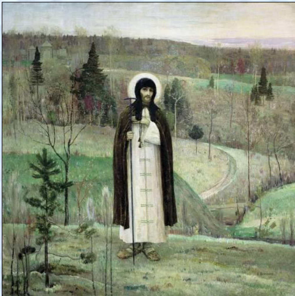
“Преподобный Сергий Радонежский” Михаил Нестеров

Сергий «тихими и кроткими словами» мог действовать на самые заgrубелые и ожесточённые сердца; очень часто примирял враждующих между собой князей, уговаривая их подчиняться великому князю московскому.