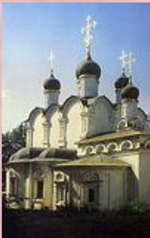
ХРАМ РАВНОАПОСТОЛЬНОГО КНЯЗЯ ВЛАДИМИРА В СТАРЫХ САДАХ