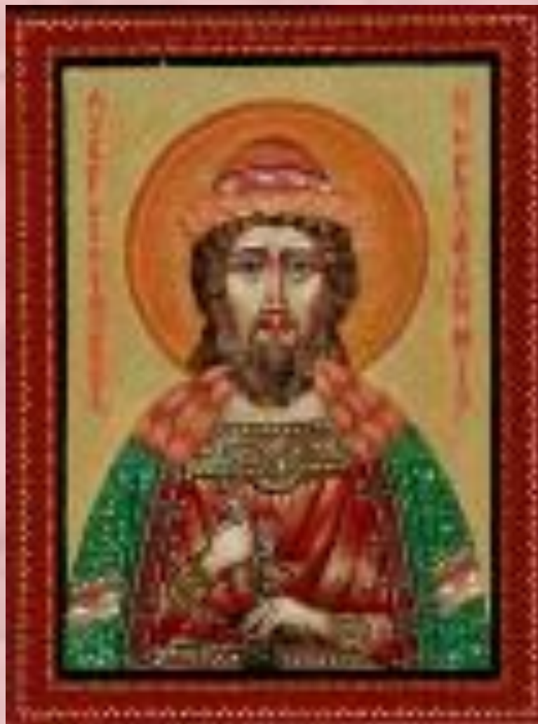
Икона Святого равноапостольного князя Владимира