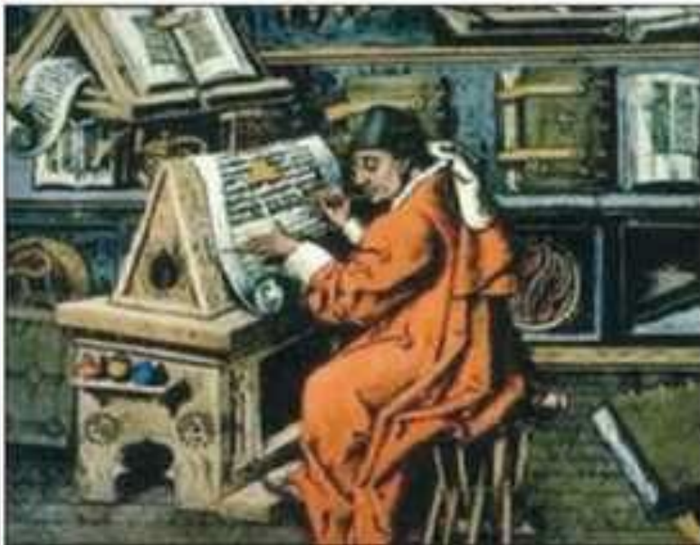
◆ Рис. 1. У монастирському скрипторії. Середньовічна мініатюра