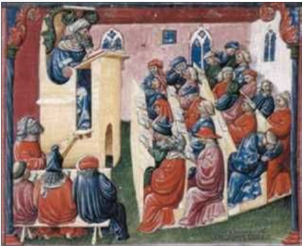
◆ Рис. 6. Університетська лекція. Мініатюра XV ст.