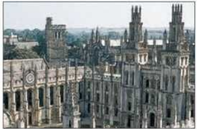
◆ Рис. 5. Оксфордський університет у XIV ст.