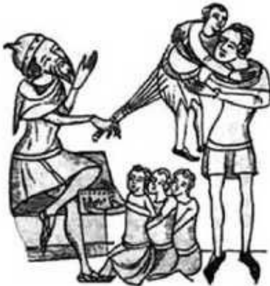
◆ Рис. 3. Покарання несумлінного учня. Із мініатюри XIV ст.