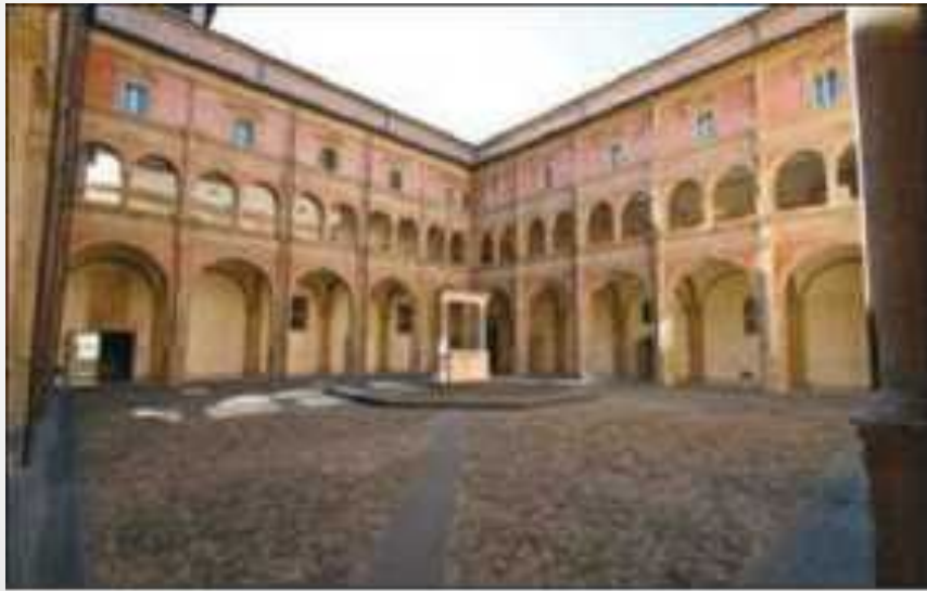
◆ Рис. 4. Внутрішній двір Болонського університету