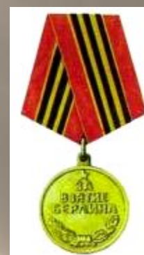
Медаль «За взятие Берлина»