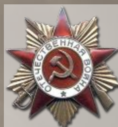
Орден Отечественно й войны 2-й степени