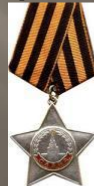
Орден Славы 3-й степени