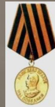
Медаль «За победу над Германией»