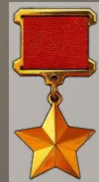
Медаль «Золотая звезда»