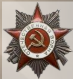
Орден Отечественно й войны 1-й степени