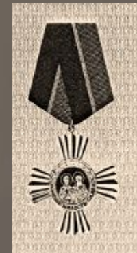
Орден «За служение Отечеству»