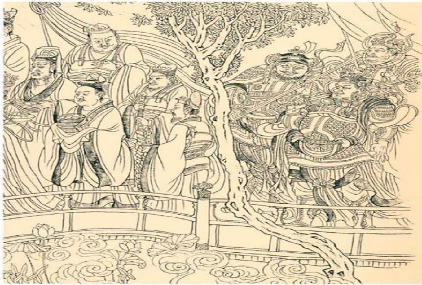
吴道子线描人物 - 八十七神仙图卷局部之十一