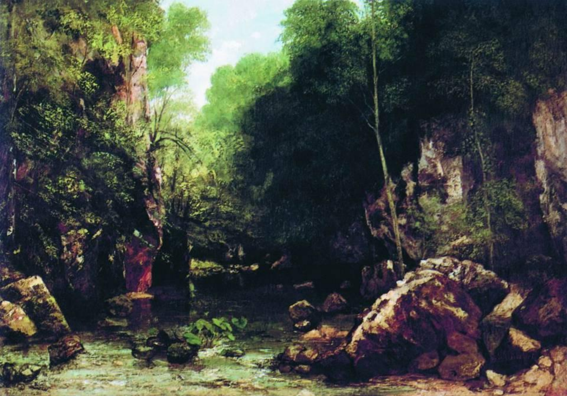
Ручей в тени