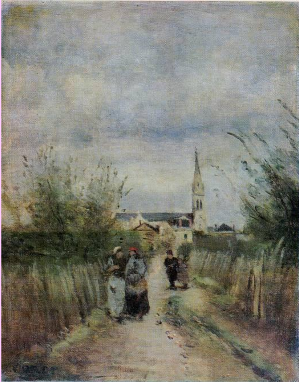
Колокольня в Анженте