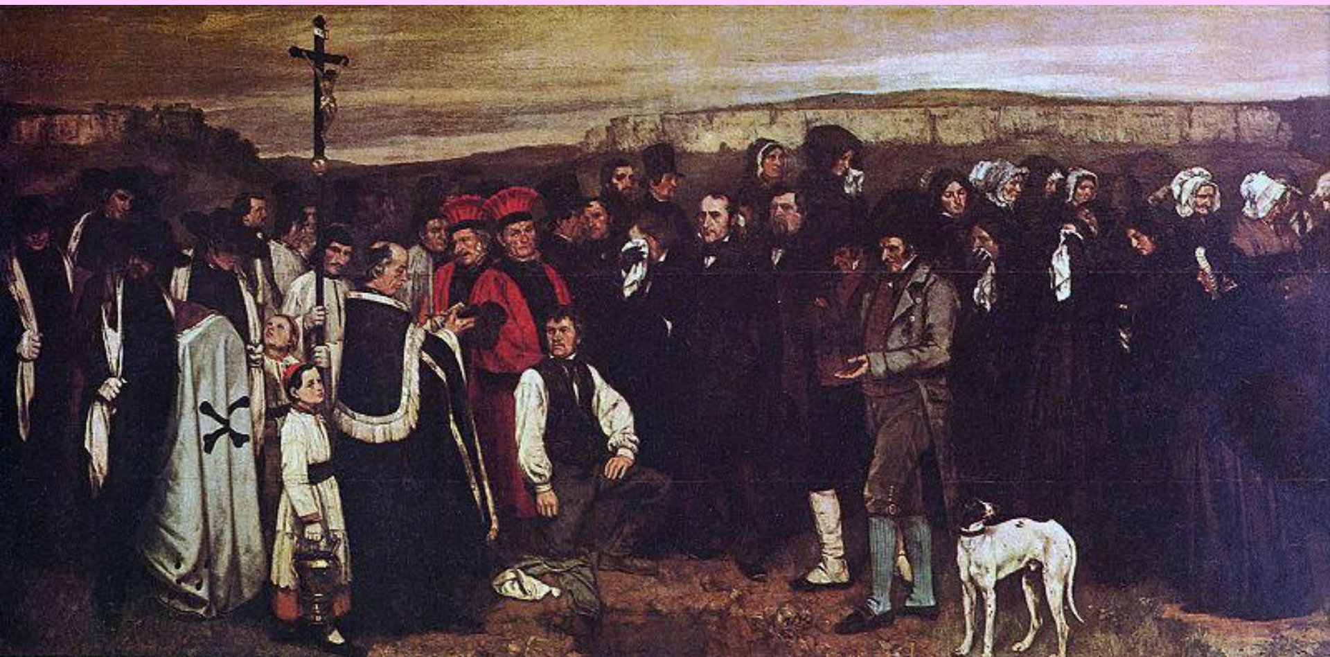
Похороны в Орнате