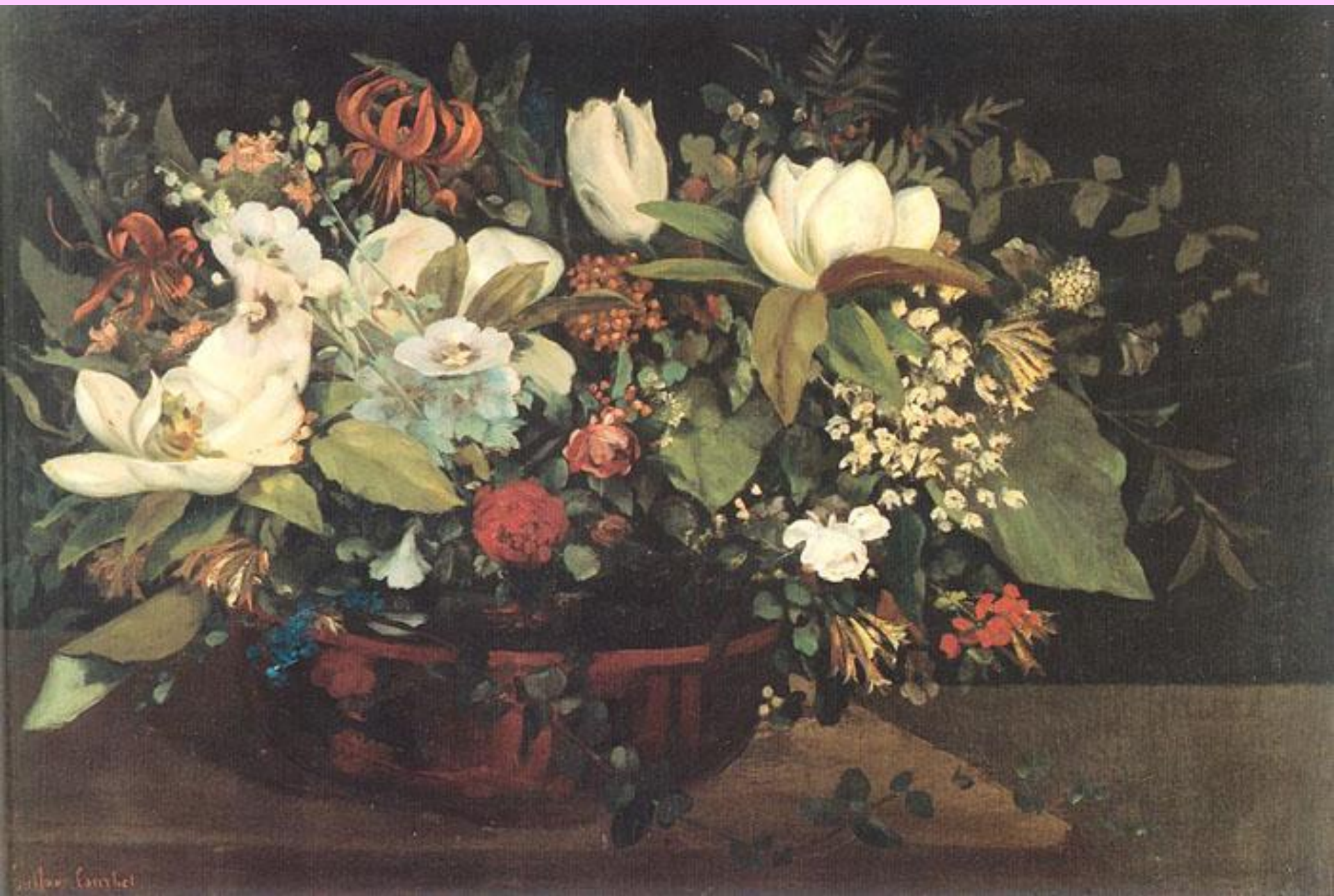
Корзина с цветами