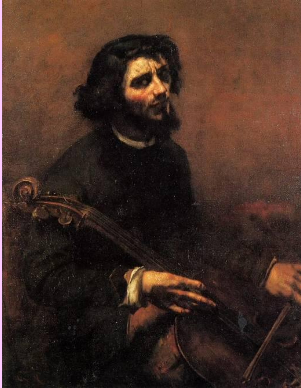
Автопортрет. Виолончелист. 1847 г.