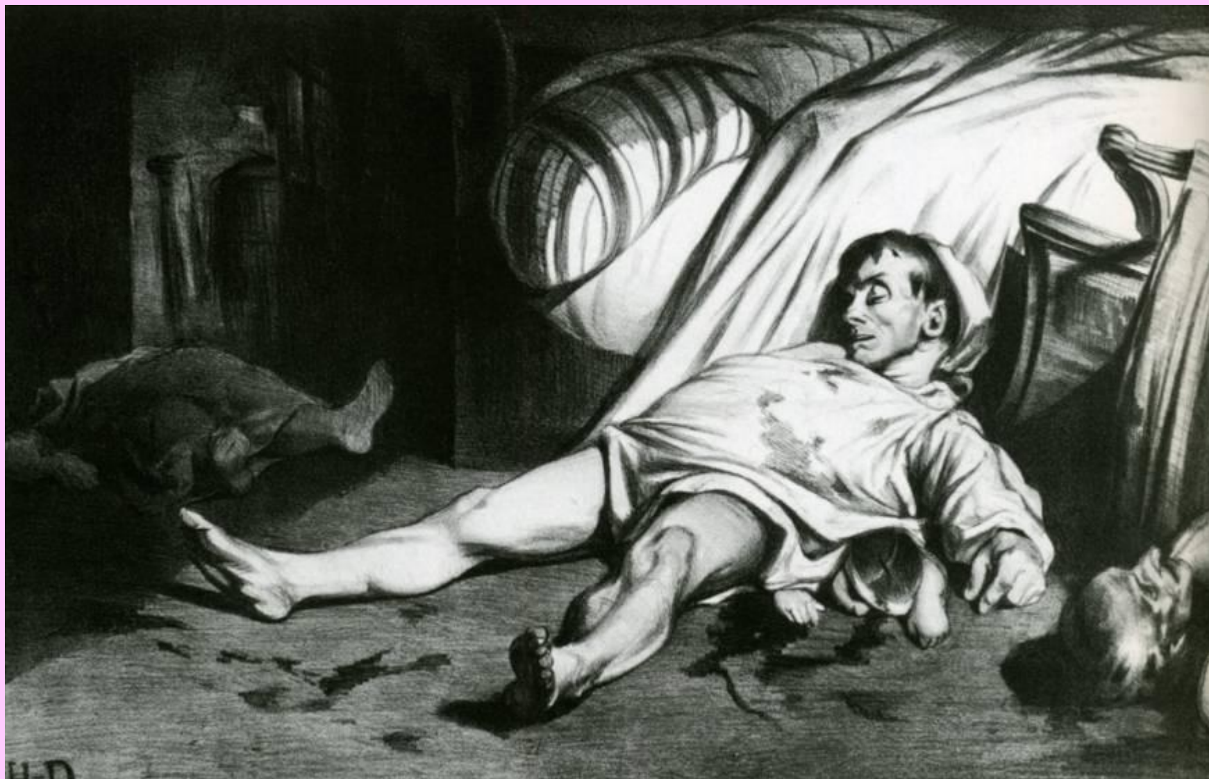
Улица Транснонен 15 апреля 1834 года.