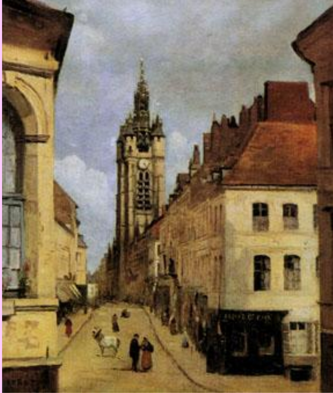
Башня ратуши в Дуэ