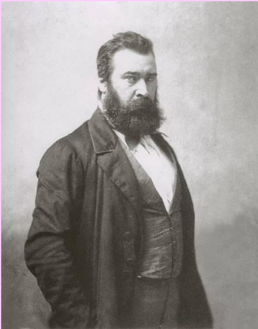
Жан Франсуа Миллэ 1814 — 1875

Милле никогда не писал картин с натуры. Он любил ходить по лесу и делать маленькие зарисовки, а потом по памяти воспроизводил понравившийся мотив. Художник подбирал цвета для своих картин, стремясь не только достоверно воспроизвести пейзаж, но и достичь гармонии колорита.