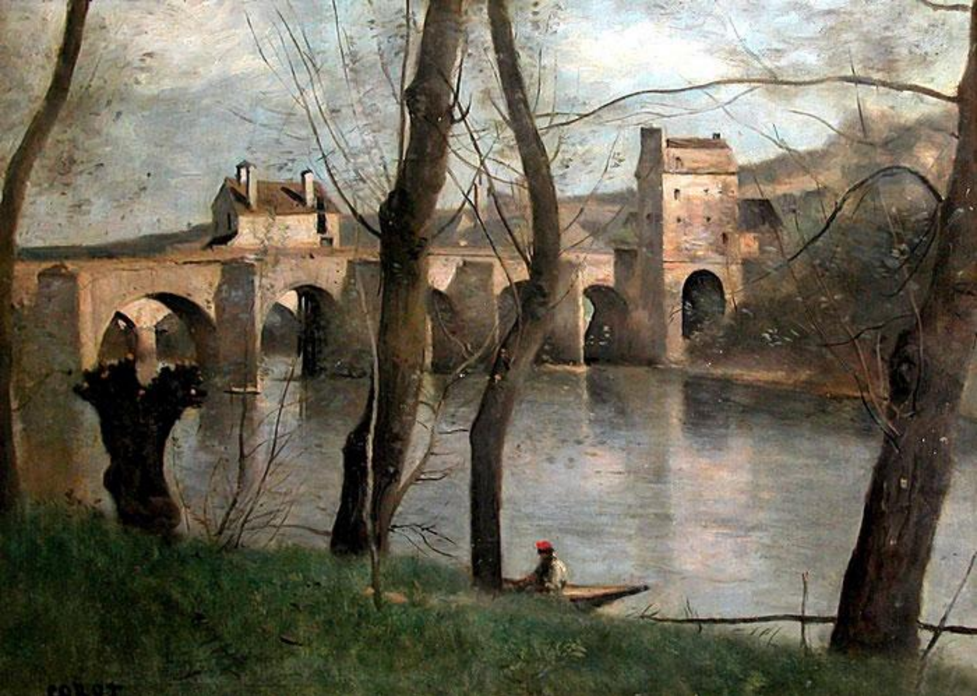
Мост в Манте