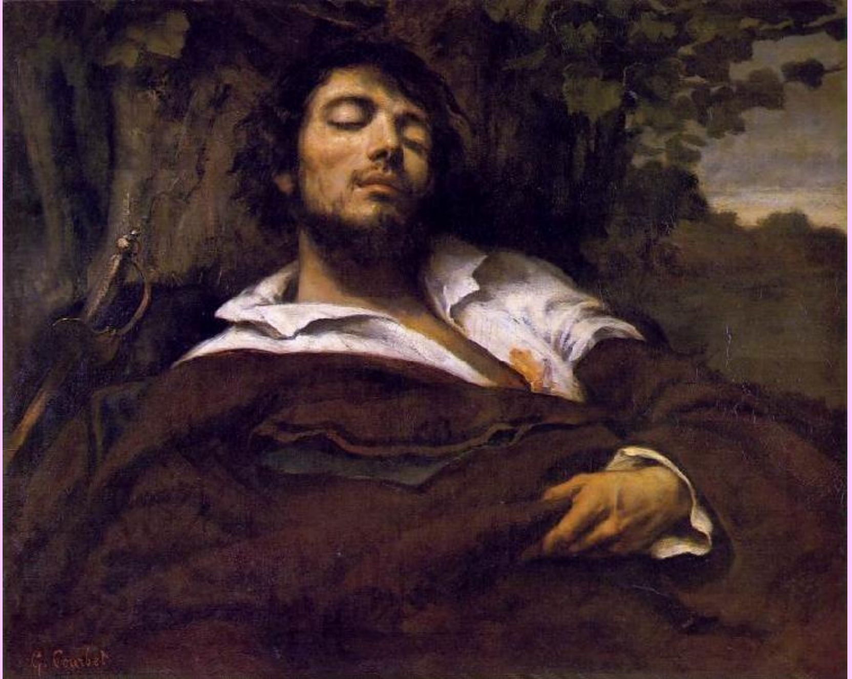
Автопортрет (Раненный мужчина)