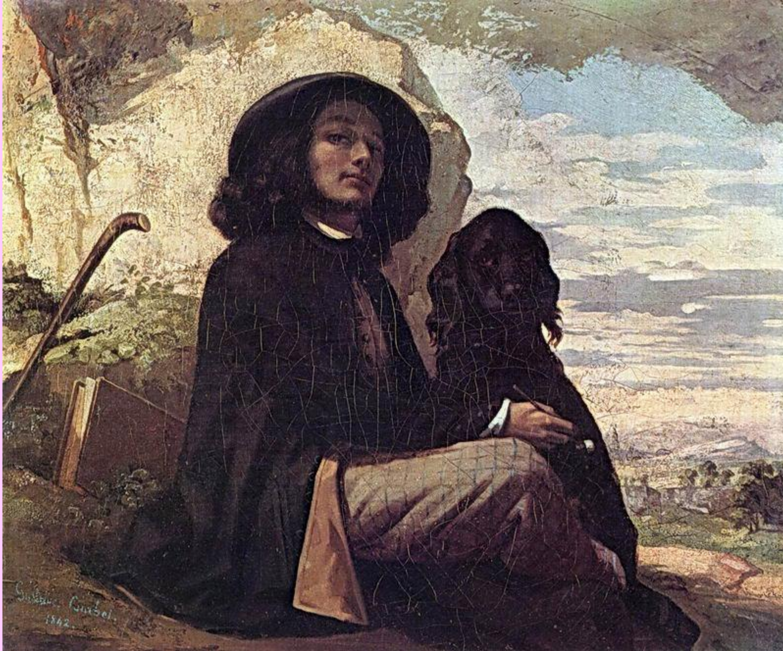
Густав Курбе Автопортрет с черной собакой