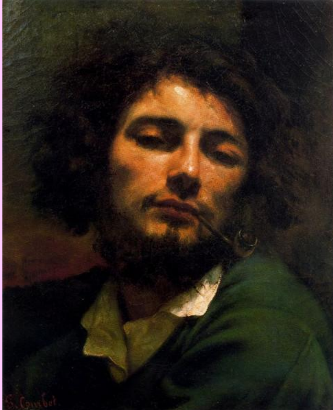
Человек с трубкой