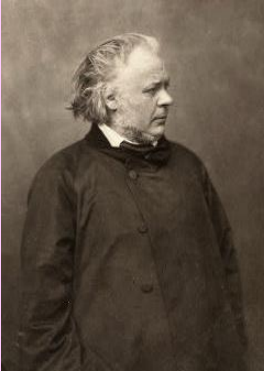
Оноре́ Викторен До́мье 1808—1879

. Рисунок Домье сух и грубоват; но представляемые им типы и сцены полны жизни, поразительной правды, и, вместе с тем едкой насмешки.