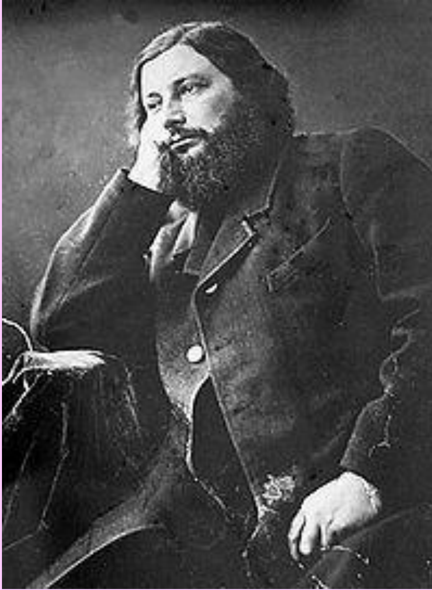
Жан Дезир  Гюста в Курб  1819-1877

считал конечной целью искусства передачу голой действительности и жизненной прозы и пренебрегая при этом даже изяществом техники.