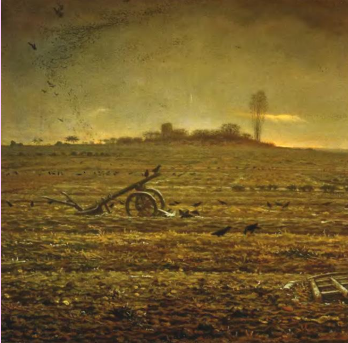
Зимнем пейзаже с воронами