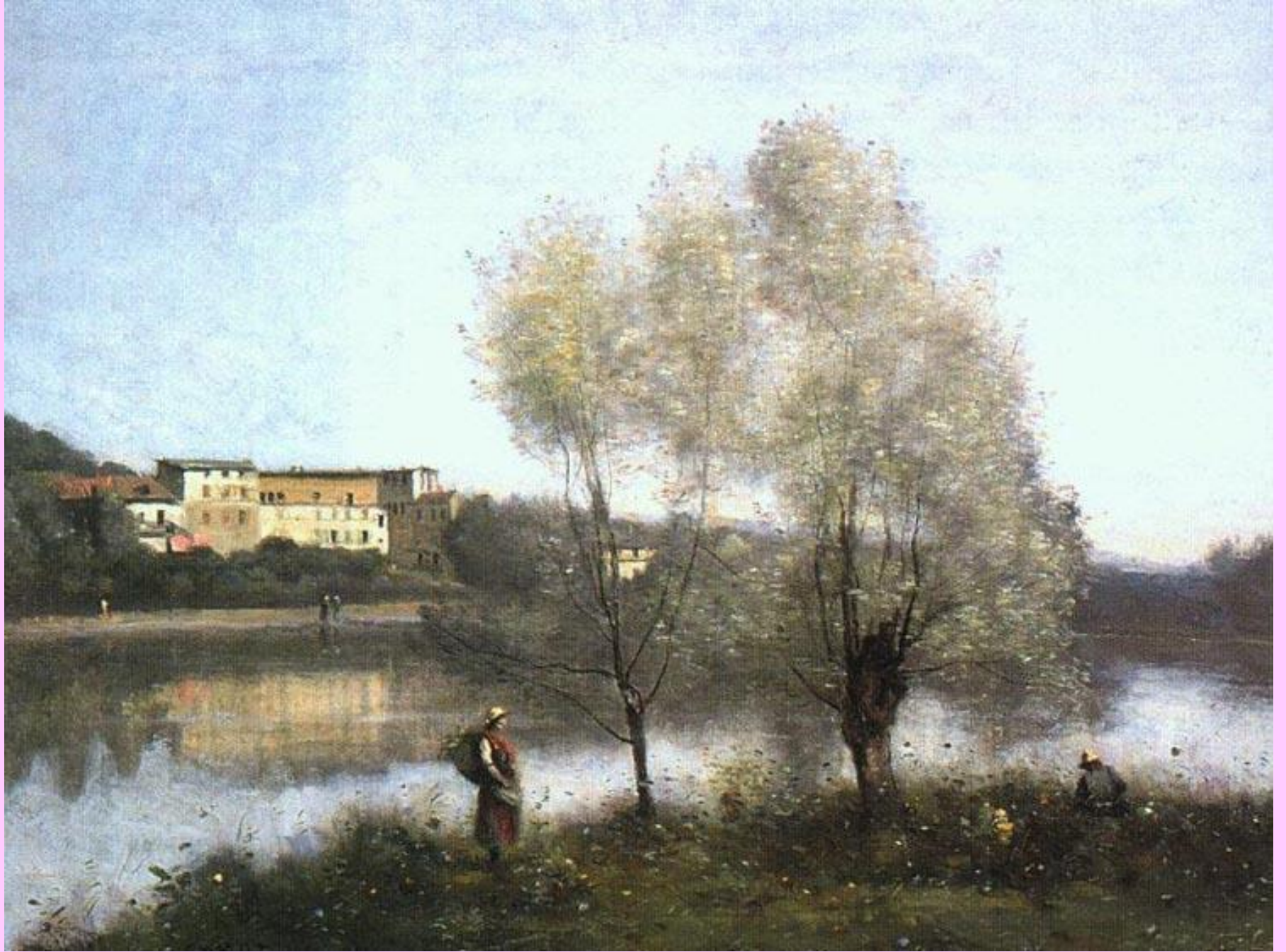
Виль д'Авре .