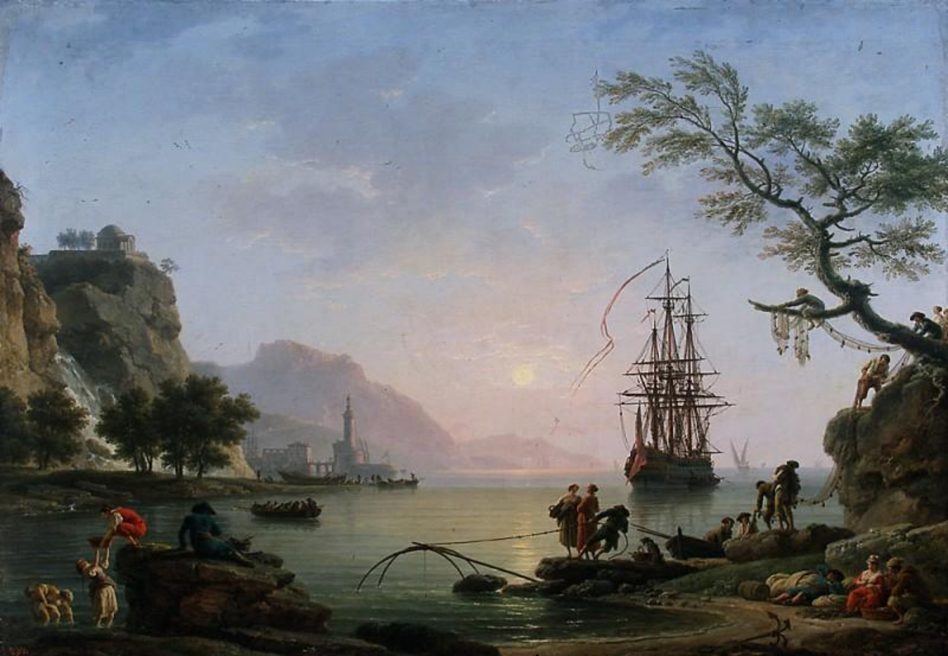
Клод Жозеф Верне