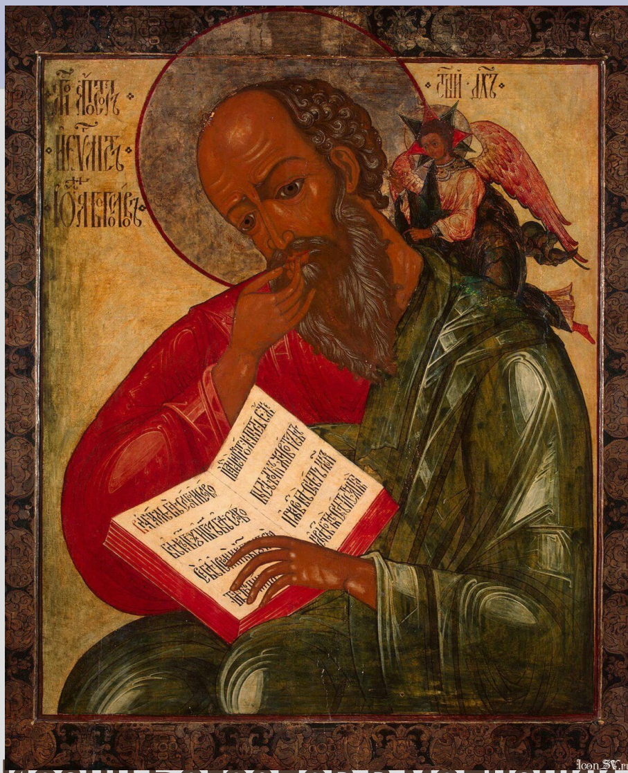
ИОАНН БОГОСЛОВ В МОЛЧАНИИ