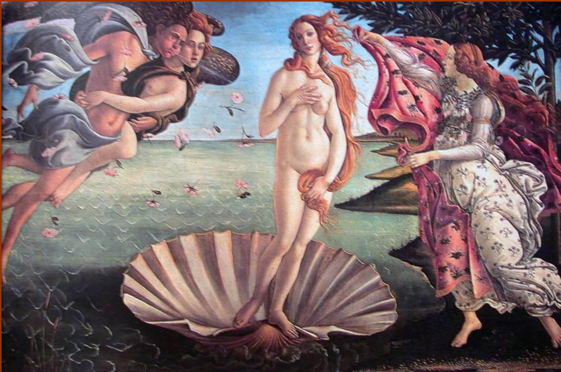
Алессандро ди Мариано Филлипепи, Рождение Венеры, 1483