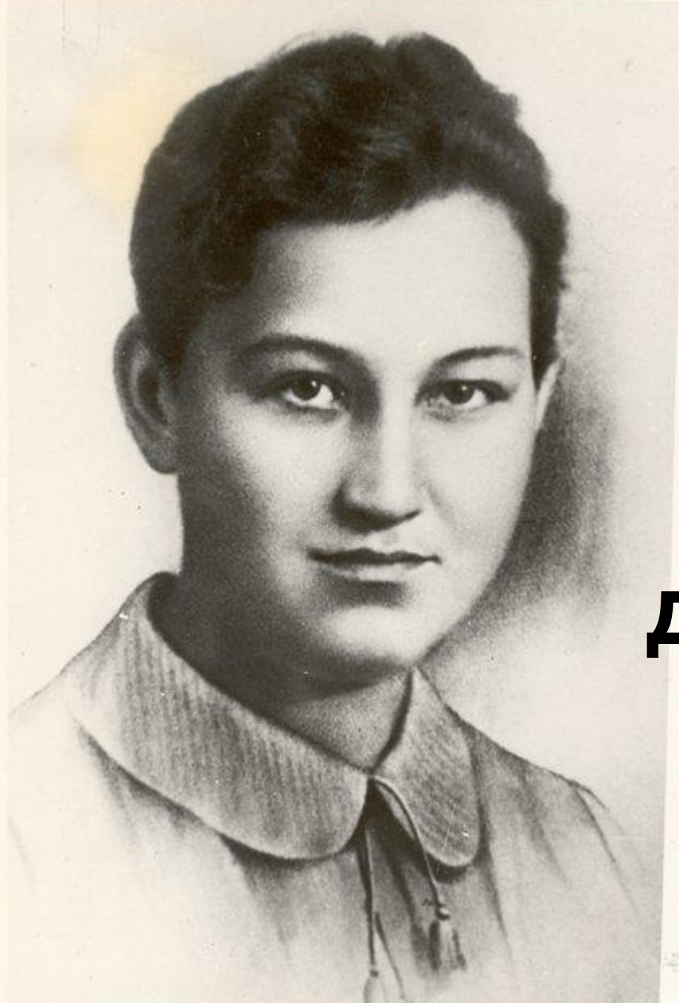
Зоя Космо- демьянск ая