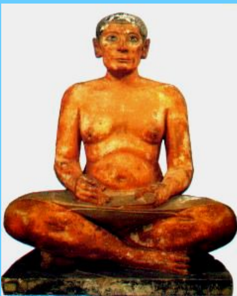
Пиисец -высокопоставленный вельможа - за работой.

Прочтите в учебнике пункт 3 (с. 44) и ответьте на вопрос: