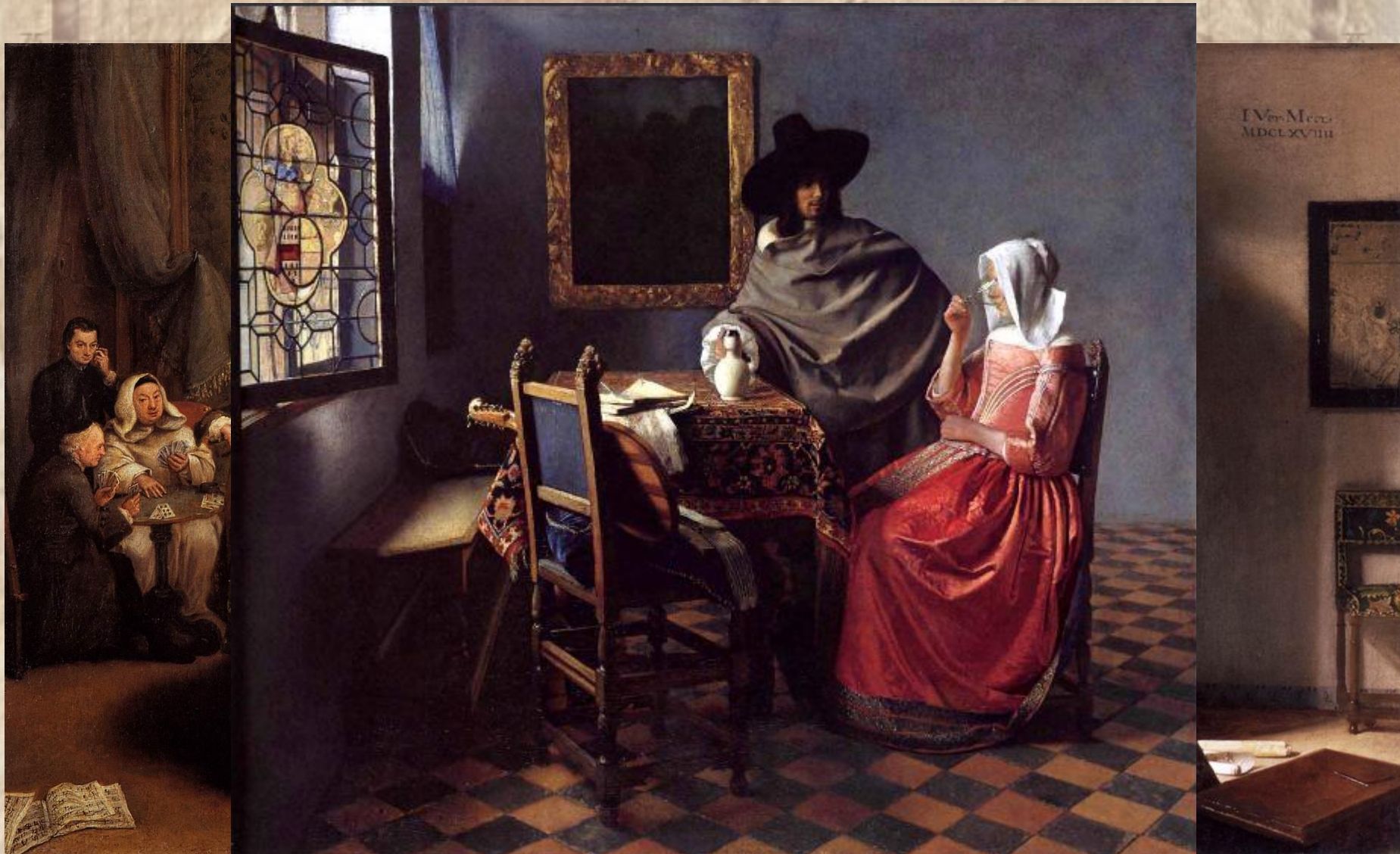
картина «Ботанический сад» художника Я. Вермеера Делфтский. Типичный интерьер голландского дома