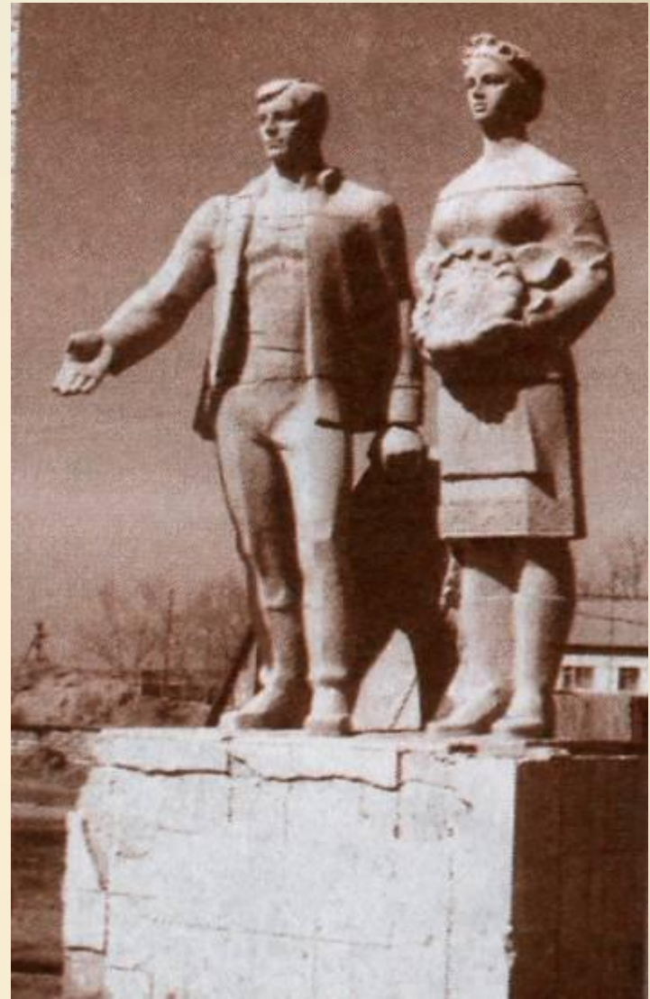
Памятник первоцелинникам. Пос. Маяк, Брединский р-он.

Постепенно улучшалось положение дел и в животноводстве. Колхозы и совхозы Урала удвоили продажу своей продукции государству. В середине 1960-х гг. на Южном Урале были созданы областные тресты всесоюзного объединения «Птицепром».