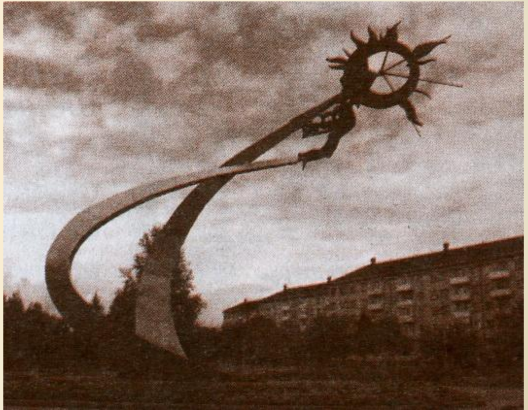
«Икар». г. Трехгорный