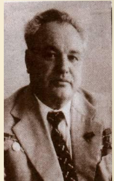
В.П.Макеев 1924-1985, конструктор баллистических ракет, академик, дважды Герой Соц. Труда.

В 1940-50-е гг. мало кто из ученых имел четкое представление о вреде радиоактивности. Поэтому в эти годы регион не раз постигали аварии на секретных объектах. Самая крупная авария произошла в 1957г. После термического взрыва в хранилище радиоактивных отходов, были заражены территории Челябинской, Свердловской, Тюменской областей. Облучению подверглось более 270 тыс. человек.