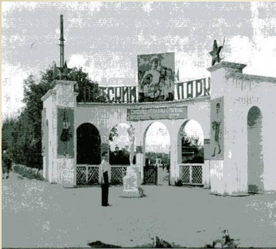
Вход в детский парк культуры и отдыха, г. Челябинск, 1948 г.

Декабрь 1958г принят закон о переходе ко всеобщему восьмилетнему образованию, а с 1959г. началась реформа по реорганизации школ с целью их политехнизации. В школах вводится обязательное производственное обучение. В 1964г. был осуществлен переход школ к десятилетнему обучению. К 1965г. В Челябинске было 12 начальных, 28 восьмилетних, 35 средних школ и 48 школ рабочей молодежи.