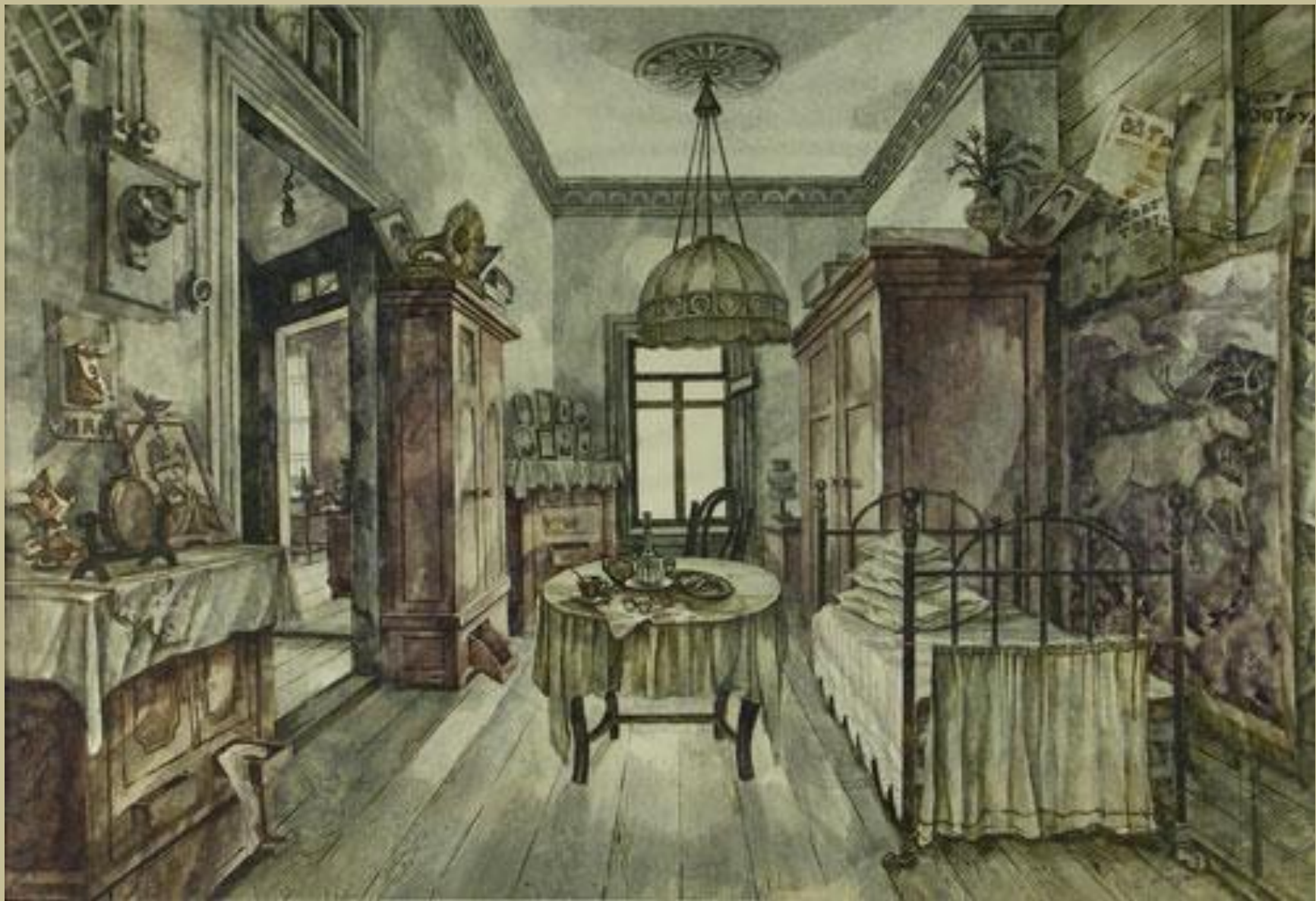
Комната в коммунальной квартире