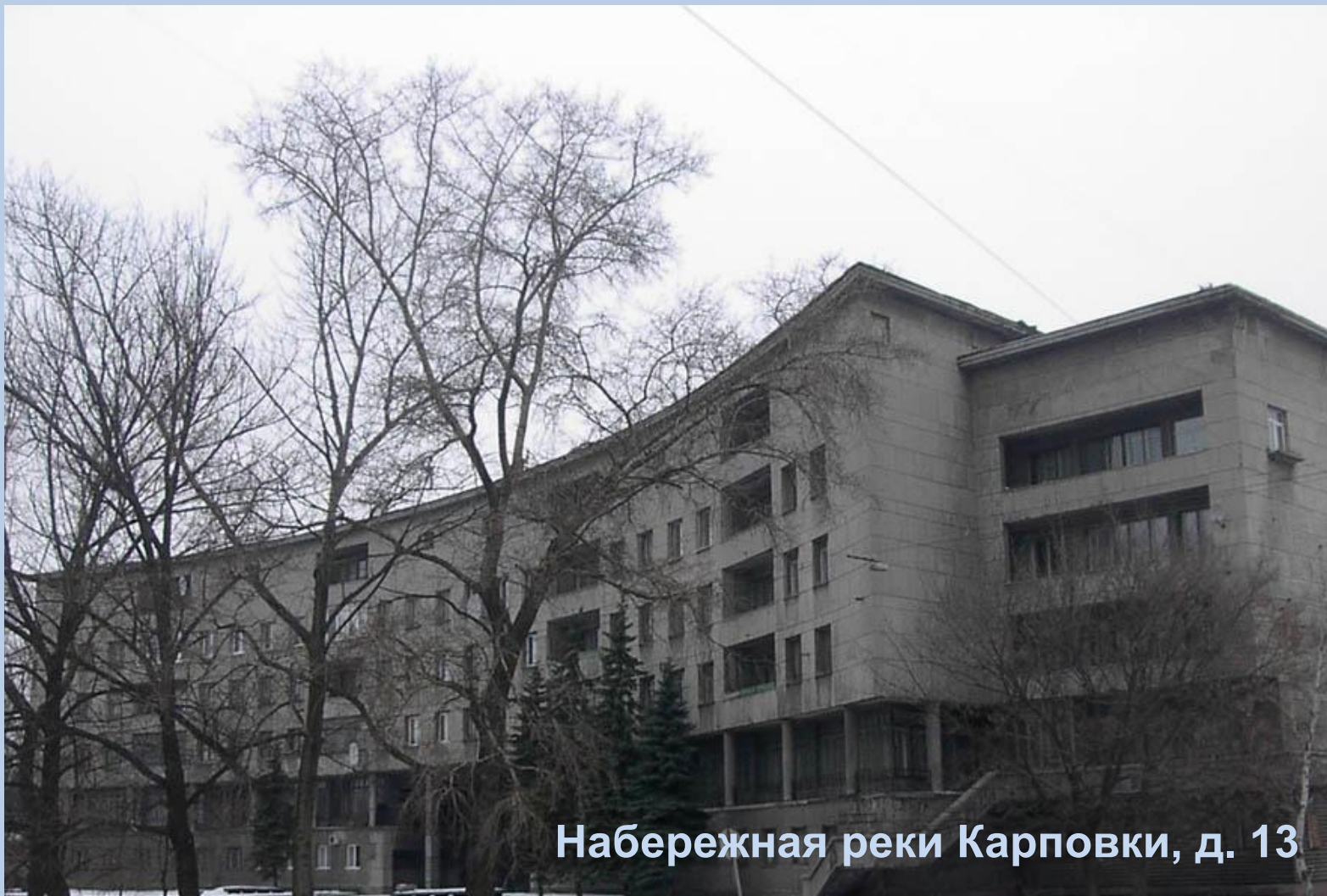
Набережная реки Карповки, д. 13

Для советских и партийных руководителей построили специальный жилой дом. В нём были большие и светлые, отдельные для каждой семьи квартиры. В них газ, ванна, телефон, холодильник, мебель и комнаты для прислуги. В этом доме были прачечная, парикмахерская, гаражи.