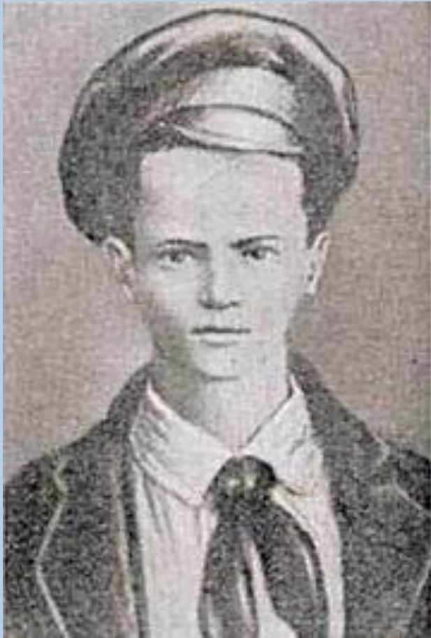
"Пионер-герой" Павлик Морозов. Официальный (идеализированный) портрет.

Среди юных пионеров активно насаждалось доносительство, и согласно идеологии сталинской эпохи, пионер обязан был быть активным агентом тайной политической полиции и сообщать в нее обо всех «безобразиях».