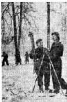
В Сокольниках.

На эстрадах в клубах театров и клубов состоится 15 концертов. И здесь — три представления.