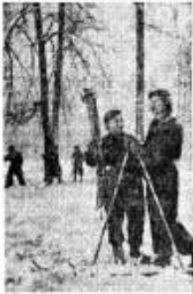
В Сокольническом.

На эстрадах в городах театров и клубов состоится 15 концертов. И здесь — три представления.