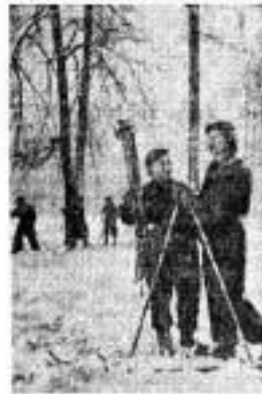
В Сокольникове.