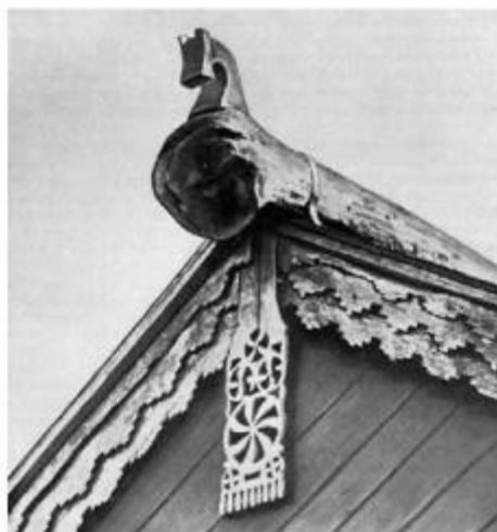
«ГРОМОВЫЙ ЗНАК» ПОД КОНЬКОМ КРЫШИ. Сосер