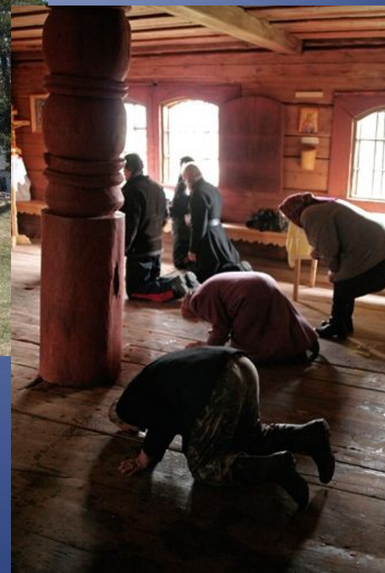
Юксовичи (Родионово). Церковь Георгия Победоносца XVI век