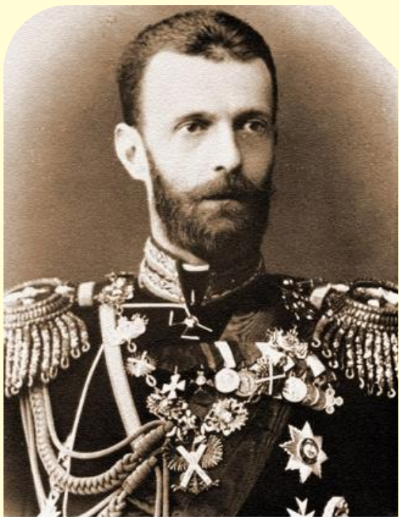
Великий Князь Сергей Александрович. Парадный портрет. 1900-е гг.