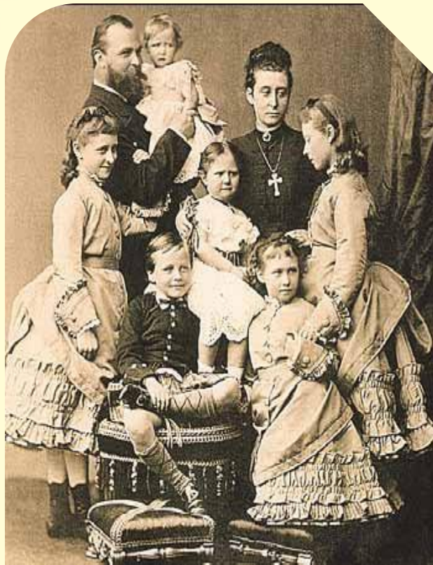
Семья Елизаветы Федоровны