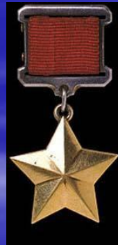
Золотая Звезда «Героя Советского Союза»

В декабре 1940 года в Генеральном штабе состоялось совещание с участием командующих войсками округов и армий, членов Военных советов и начальников штабов. На нем выступил с докладом и генерал армии Г. К. Жуков. Он подчеркнул, что нападение на СССР фашистской Германии неизбежно. Красная Армия будет иметь дело с самой сильной армией Запада. Исходя из этого Георгий Константинович в качестве важнейшей выдвигал задачу ускорения сроков формирования танковых и механизированных соединений, укрепления Военно-Воздушных Сил и противовоздушной обороны.