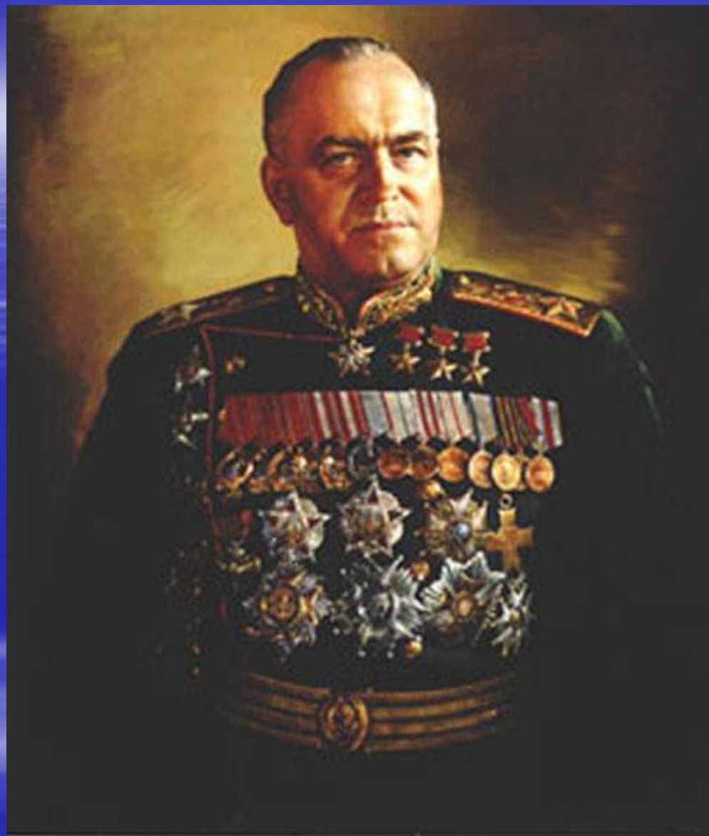
Маршал Советского Союза Георгий Константинович Жуков