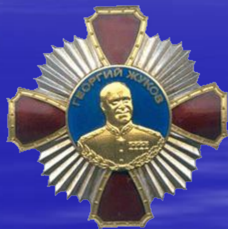
Медаль «Георгий Жуков»