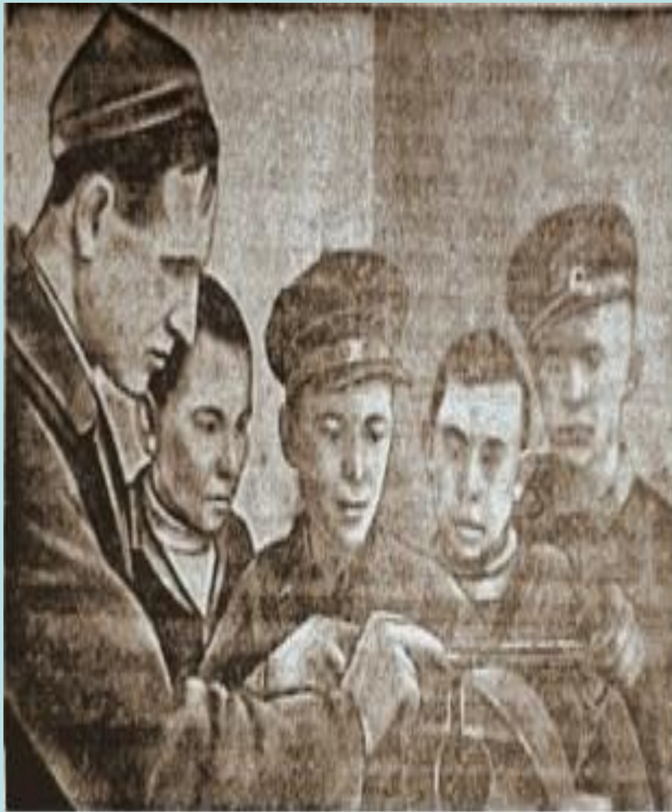
Учащиеся школы ФЗО. 1940 год.