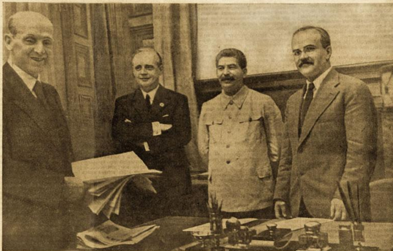
К заключению советско-германского договора о ненападении. На снимке (справа налево): тов. В. М. Молотов, тов. И. В. Сталин, г-н Иоахим фон Риббентроп и г-н Ф. Гаус.

23 августа 1939 два смертельных врага - нацистская Германия и Советский Союз подписали договор о дружбе и ненападении, условившись, однако, поделить Польшу между собой