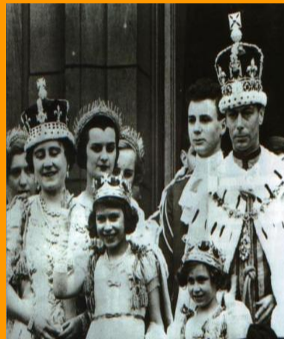
ЕЛИЗАВЕТА ВТОРАЯ С РОДИТЕЛЯМИ И СЕСТРОЙ

Королева Елизавета II родилась 21 апреля 1926 года в Лондоне.