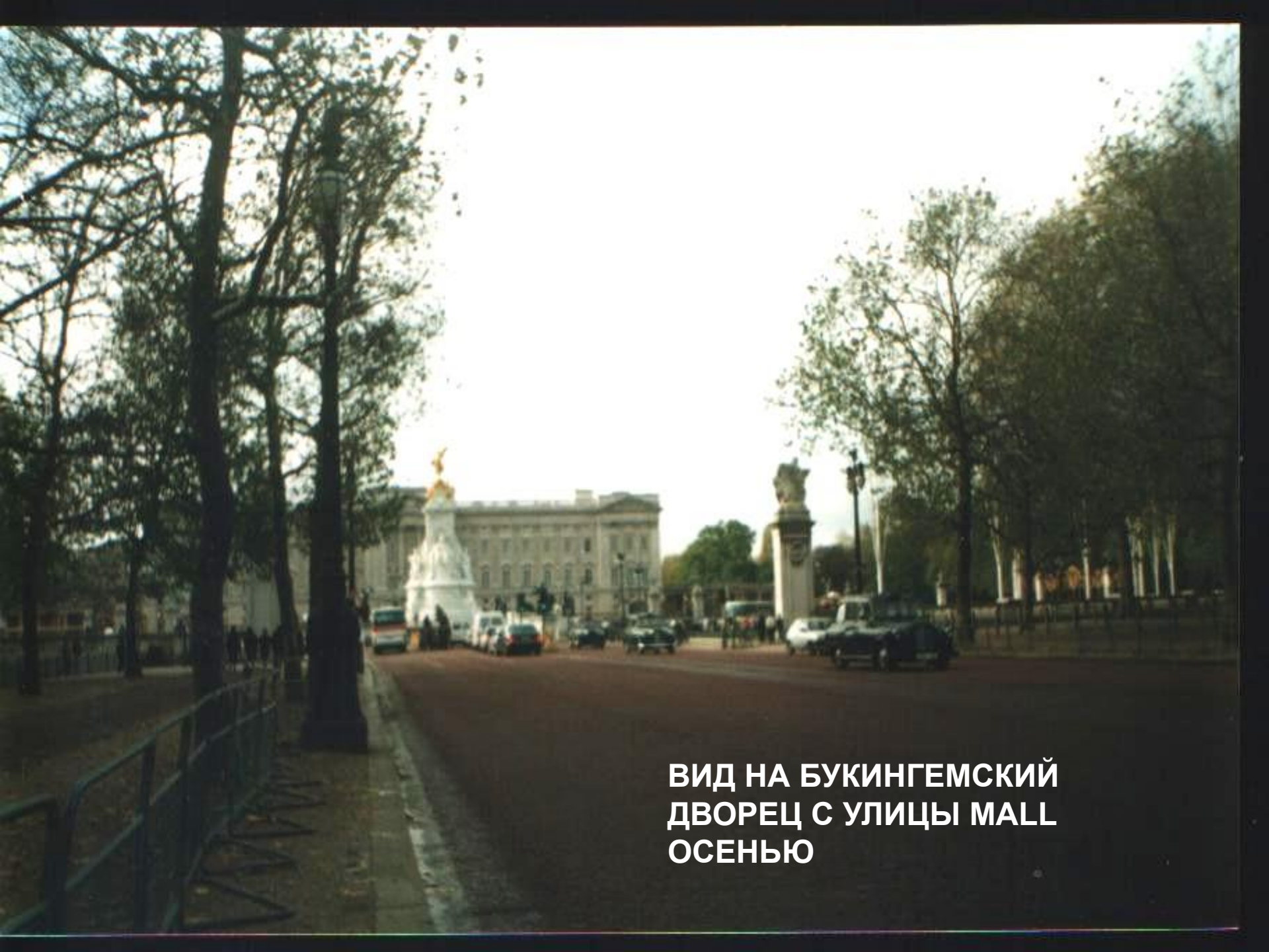
ВИД НА БУКИНГЕМСКИЙ ДВОРЕЦ С УЛИЦЫ МАЛЛ ОСЕНЬЮ