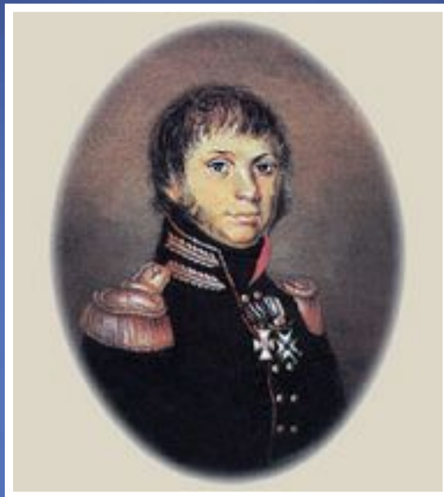
Александр Самойлович Фигнер