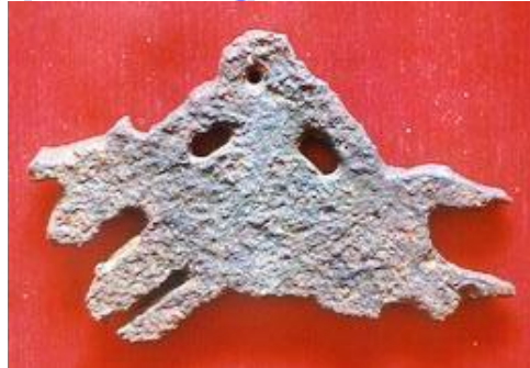
Всадник на лошади Литье. Чугун Длина 12,4 см, ширина 8 см. 12 век