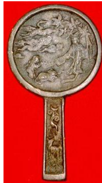
Зеркала имеют боковую ручку,