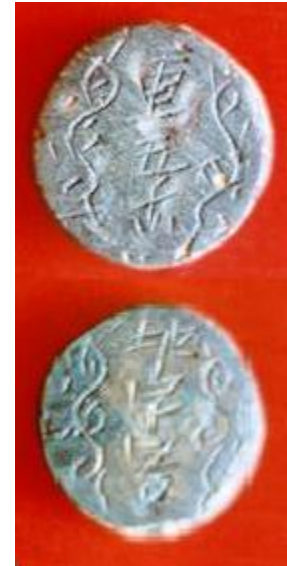
Мера веса. Лицевая и оборотная сторона. Бронза. Диаметр 2,4 см. 12 век.