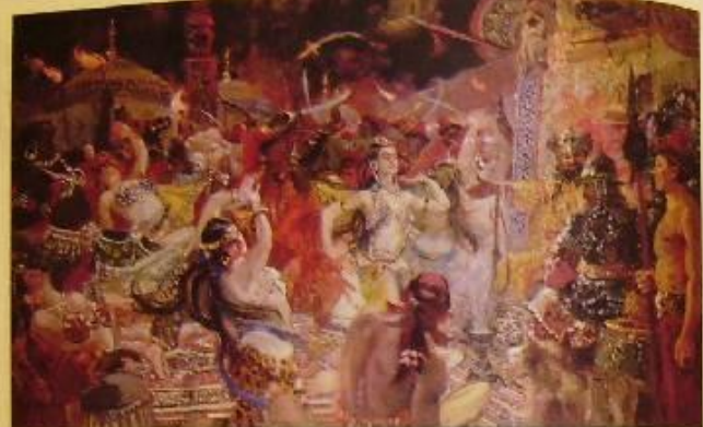
Александр Герасимов Получивший награды

Скоро же опера во сюжеты «Сидея после Игоря» про- Милка князь Игорь и пе- русской доним, и патристиче- ской опере французского школа.