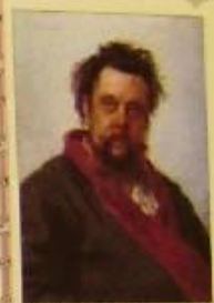
Илья Петров. Портрет композитора М.П. Мусоргского. 1881 г.

Все это делалось не случайно, побуждений, в кружке были принято говорить правду в глаза. Музыка Мусоргского шла своей оригинальностью не укладывалась в общепри- нятые рамки и воспринималась как нечто несобуданное, стихийное. Другим казалось, что его произведения требует доработки, и они стремились их улучшить. Но тогда тер- лась идея о том, присудить му- зыке М.П. Мусоргского.