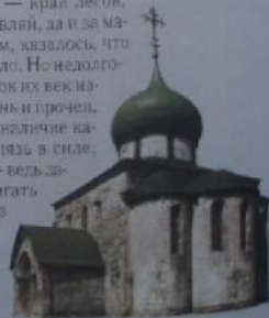
Троицкий собор Юрия-Польского. 1290—1294 гг.

Русь не была тогда единой державой. Она распалась на множество княжеств, меж которыми не было не только мира и согласия, но часто шла самая настоящая война. Сперва шли они в крепостях-столицах городов, пышностью теремов, великолепием храмов. Каждый князь строился во всем преуспеянии соседа. Северо-Восточная Русь — край лесов, строителей много материала хоть отбавляй, да и за мастерами, которые обычным топором, казалось, что увидишь сотворить могут, дело не стало. Но недолго — деревянные строения, коротких их век из-за постоянных пожаров. А вот камень и прочнее, и надежнее, и прочнее. К тому же наличие каменных зданий показывает, что князь в силе, земля его богата, а казна не пуста — ведь далеко не всякому по карману воздвигать дома, а тем более дворцы и соборы из камня. В летописях о том, что тот или иной князь «заложил церковь»