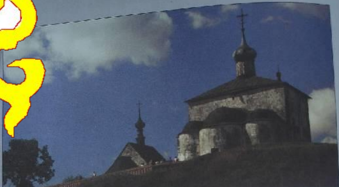
Церковь Троицы и Давид. Киевская (или Суздальская). 1152 г.