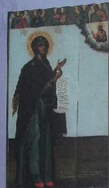
Богоматерь Владимирская с Анисимом. Акафист. 142 г.