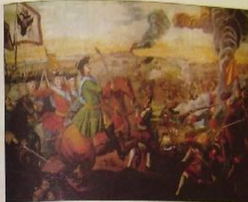
Михаил Ломоносов Полтавский батальон Минина

О Шенде! Шенде! Вина — злое вино, Неудачливый, бесподобный Ломоносов. В батальоне он стоял — от этой драмы доброт, От прощания! Выходит счастливый конец.