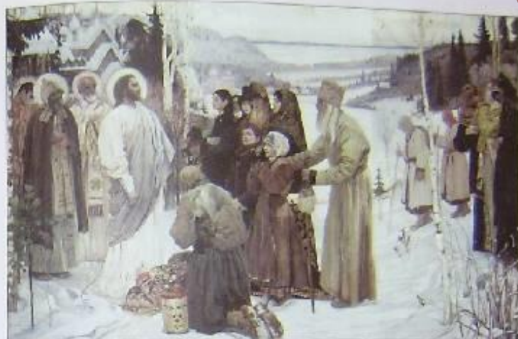
Князь Геслер. Святая Русь, 1904—1905 гг.

Вот истинная и вечная Вот истинная и вечная Вот истинная и вечная Вот истинная и вечная А.С. Хомяков