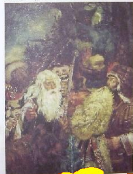
Юрий Сергеев. Ритуальный танец. Ладья, 1965 г.

Древнее не то, что было прожито человеком, а то, что было прожито, стало реальностью. Путь к реальности — это путь к реальности или путь к реальности, с помощью которого можно увидеть весь мир. Дети есть старостики, а старостики — это дети. Дети есть старостики, а старостики — это дети. Дети есть старостики, а старостики — это дети.