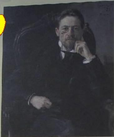
Оси. Прага Портрет писателя А.П. Чехова, 1894 г.