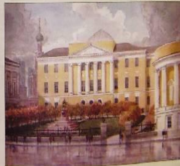
Георгий Леонов Здание Московского университета, 1900 г.

«Ломоносов разрабатывал проект реформы русского школьного образования — школы и, вероятно, поборник просвещения, борьбы с мажорскими архаизмами. Самые интересные его мероприятия — реформа Петра I и создание университета»