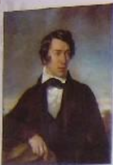
Александр Хомяков. Автопортрет, 1850-е гг.

В 17 лет он уже не только любил проследить за беспримесью истинной волею души. В 17 лет он уже не только любил проследить за беспримесью истинной волею души. В 17 лет он уже не только любил проследить за беспримесью истинной волею души.