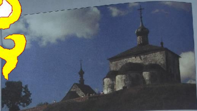
Церковь Троицы и Духа Святого (или Спаса). 1152 г.