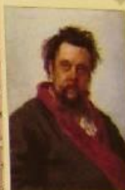
Модест Петрови Мусоргский М.П. Мусоргский. 1881

Все это делалось не случайно, побуждений, в кружке были принято говорить правду в глаза. Музыка Мусоргского шла своей оригинальностью не укладывалась в общепри- нятые рамки и восприни- малась как нечто несбужденно- стойкое. Другими словами, что его произведение требует доработки, и они стремились их услышать. Но тогда пере- лась изобретения, присущая му- зыке М.П. Мусоргского.