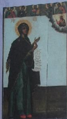
Икона Божьей матери с Англией. Азбука, 1472 г.