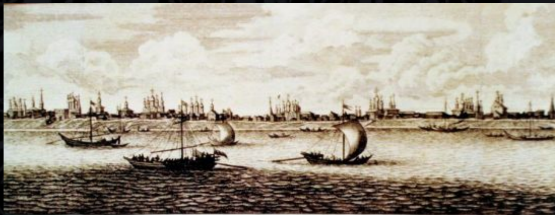
Азия. Суровых изъездов. Voyages en 1701-1708 de Corneille Le Bruin. Amsterdam. 1718 in fr.