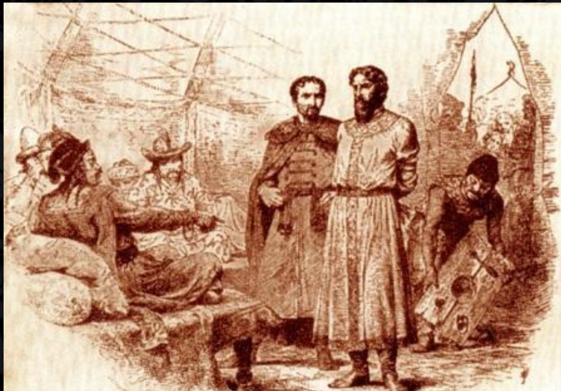
Хан Узбек принимает русского князя

Торговые пути стали не только безопасными, но и благоустроенными.