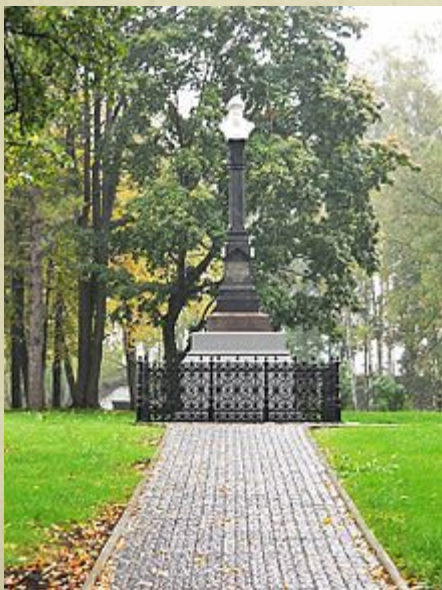
Памятник основателю города князю Василию