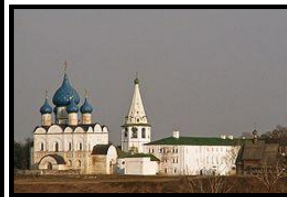
Богородице-Рождественский собор (Суздаль)