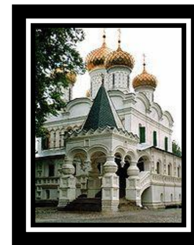
Ипатьевский монастырь. Троицкий собор.