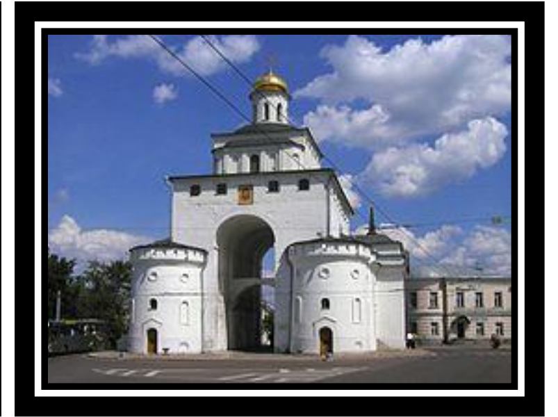
Владимир. Золотые ворота