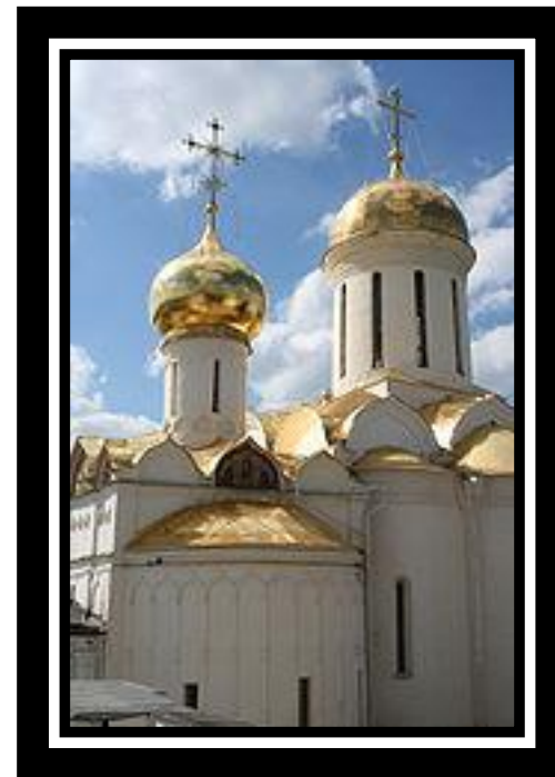
Сергиев Посад. Троицкий собор Троице-Сергиевой лавры