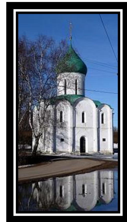
Переславль-Залесский. Спасо-Преображенский собор