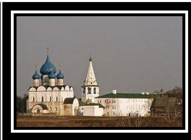
Богородице-Рождественский собор (Суздаль)