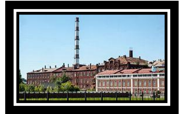
Большая ивановская мануфактура