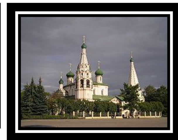
Церковь Ильи Пророка