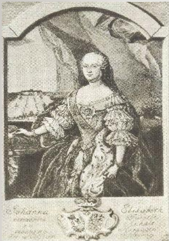
Принцесса Иоганна-Елизавета Ангаль-Цербстская