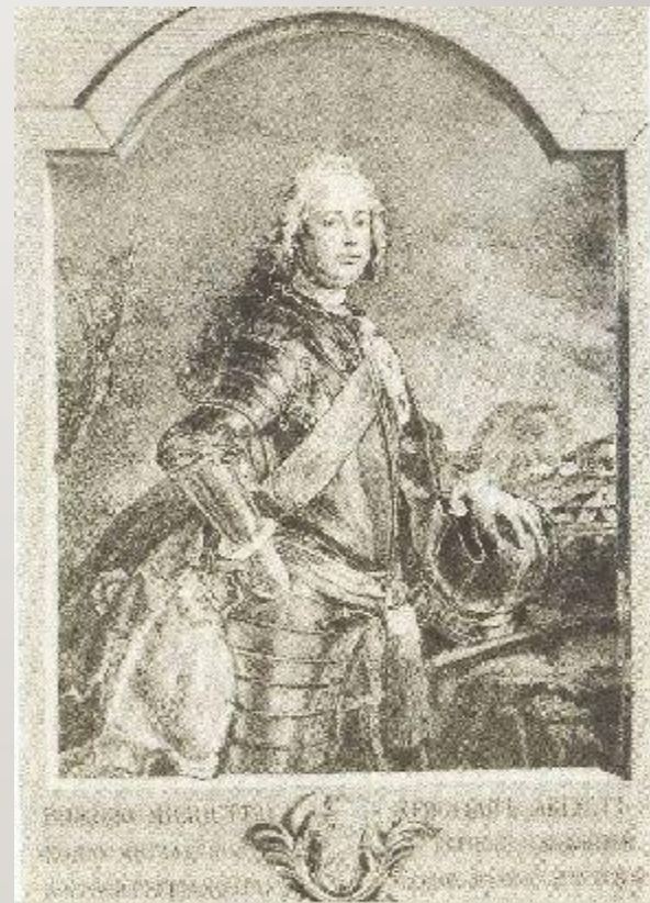
Принц Христиан-Август Ангаль- Цербстский