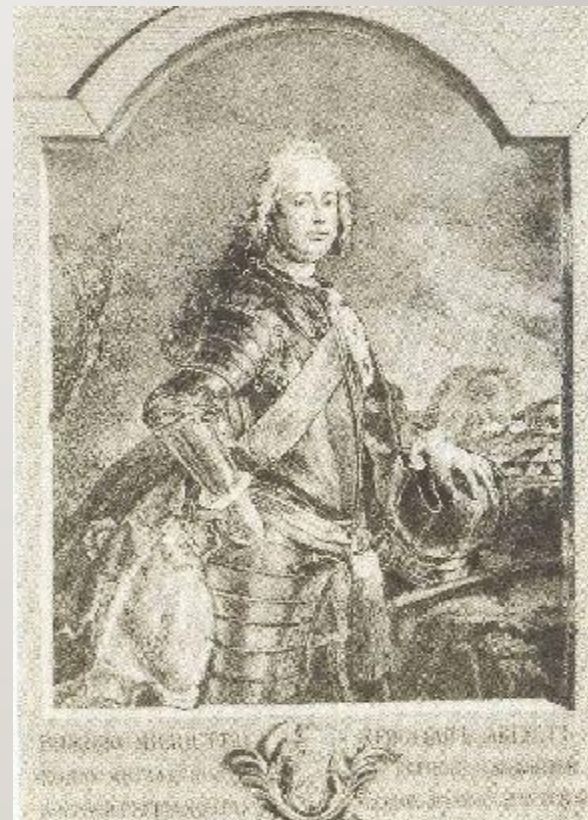
Принц Христиан-Август Ангаль- Цербстский