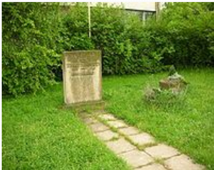
Обелиск в память Зои Космодемьянской перед 46 средней школой в г. Дрезден