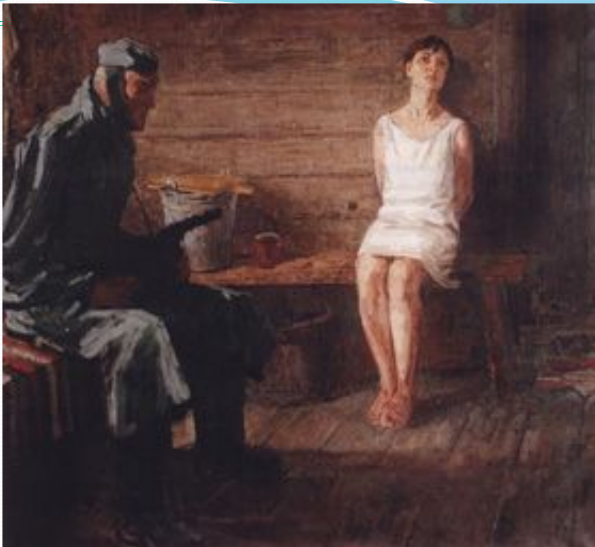
Щукин В.Г. Зоя Космодемьянская - холст, масло