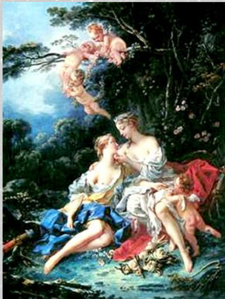
«Юпитер и Каллисто» Франсуа Буше

Когда-то Медведица была вовсе не медведицей, а красавицей по имени Каллисто . Ее полюбил могущественный бог Зевс. Разгневанная жена Зевса - злая богиня Гера - решила убить Каллисто. Тогда Зевс превратил Каллисто в медведицу, чтобы спрятать ее от Геры. Некоторое время несчастная Каллисто жила на Земле в виде медведицы. Но это тоже было для нее опасно. Однажды, возвращаясь с охоты, сын Каллисто чуть-чуть не убил собственную мать, так как он подумал, что перед ним обыкновенная медведица.