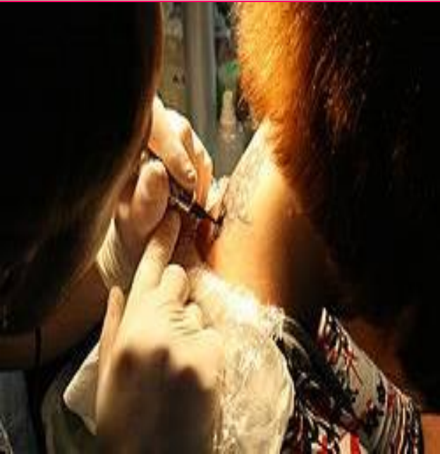
Процесс нанесения татуировки