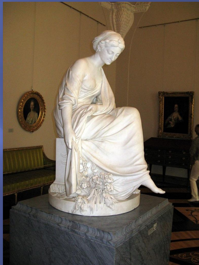
Зима, 1771. Мрамор. Эрмитаж