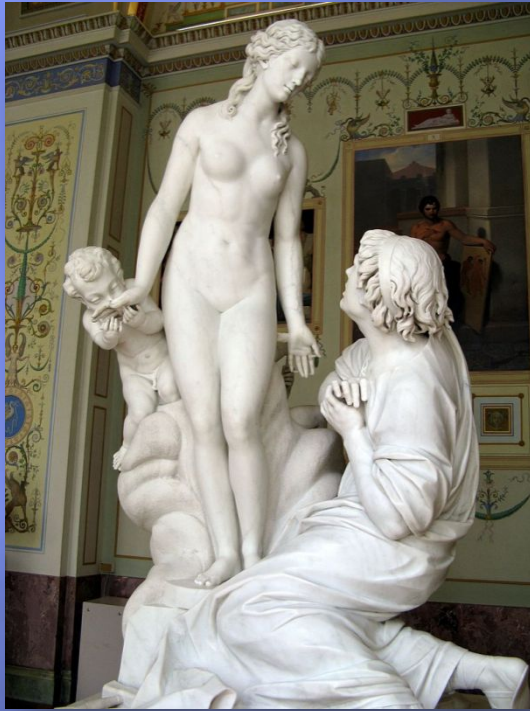
Пигмалион и Галатей, 1797. Мрамор. Государственный Эрмитаж