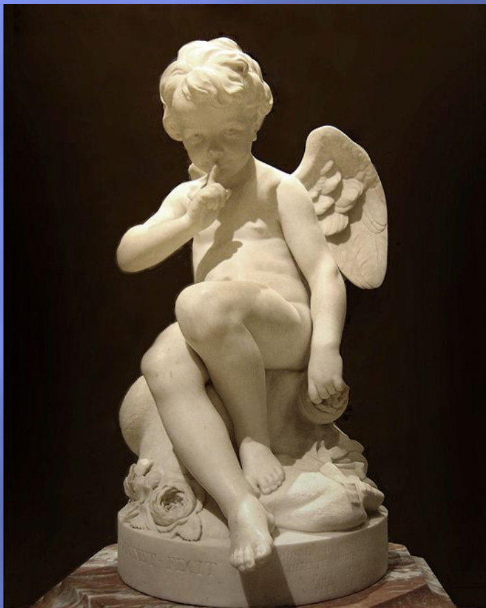
Грозящий Амур, 1755. Мрамор. Лувр, Париж