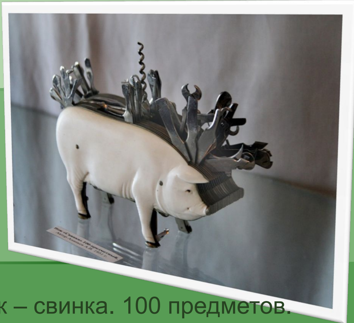
Нож – свинка. 100 предметов.