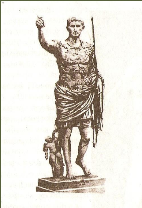
Статуя Октавиана Августа

Античное искусство Греции и Рима показывает красоту физически совершенного человека.