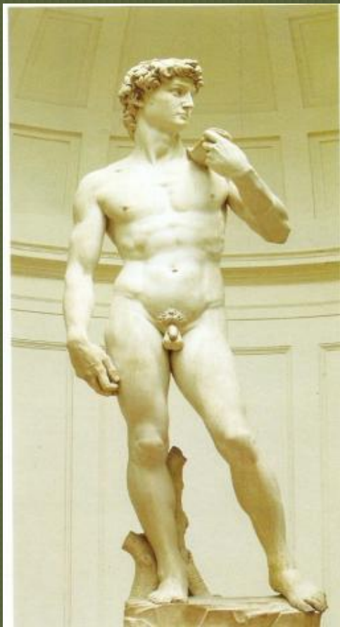
Микеланджело. Давид 1501-1504

Эпоха итальянского Возрождения подарила миру великолепные скульптурные образы и множество живописных произведений.