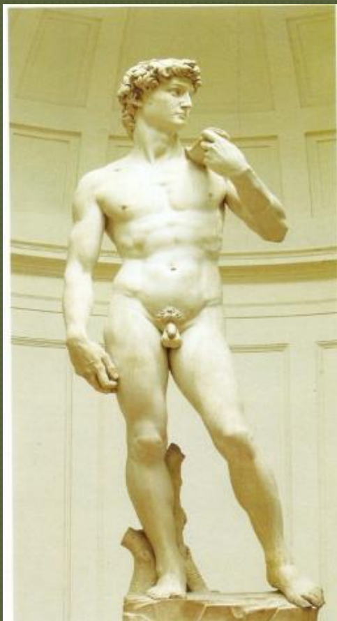
Микеланджело. Давид 1501-1504

Эпоха итальянского Возрождения подарила миру великолепные скульптурные образы и множество живописных произведений.