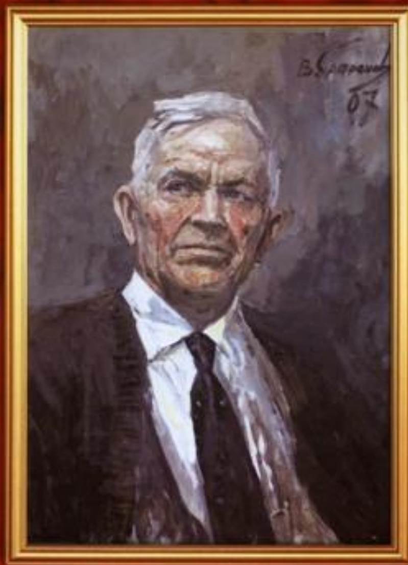
Пластов Аркадий Александрович