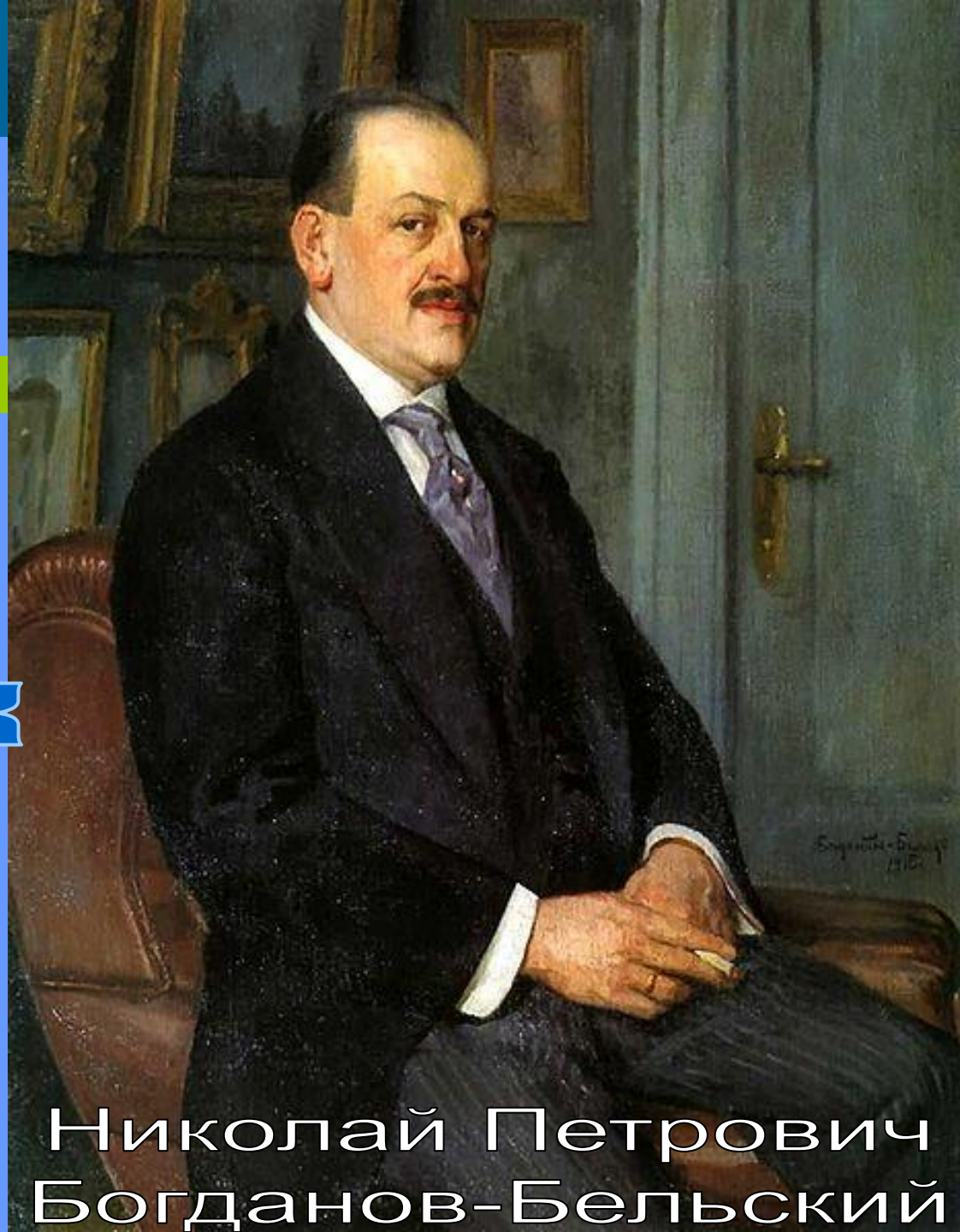
Николай Петрович Богданов-Бельский