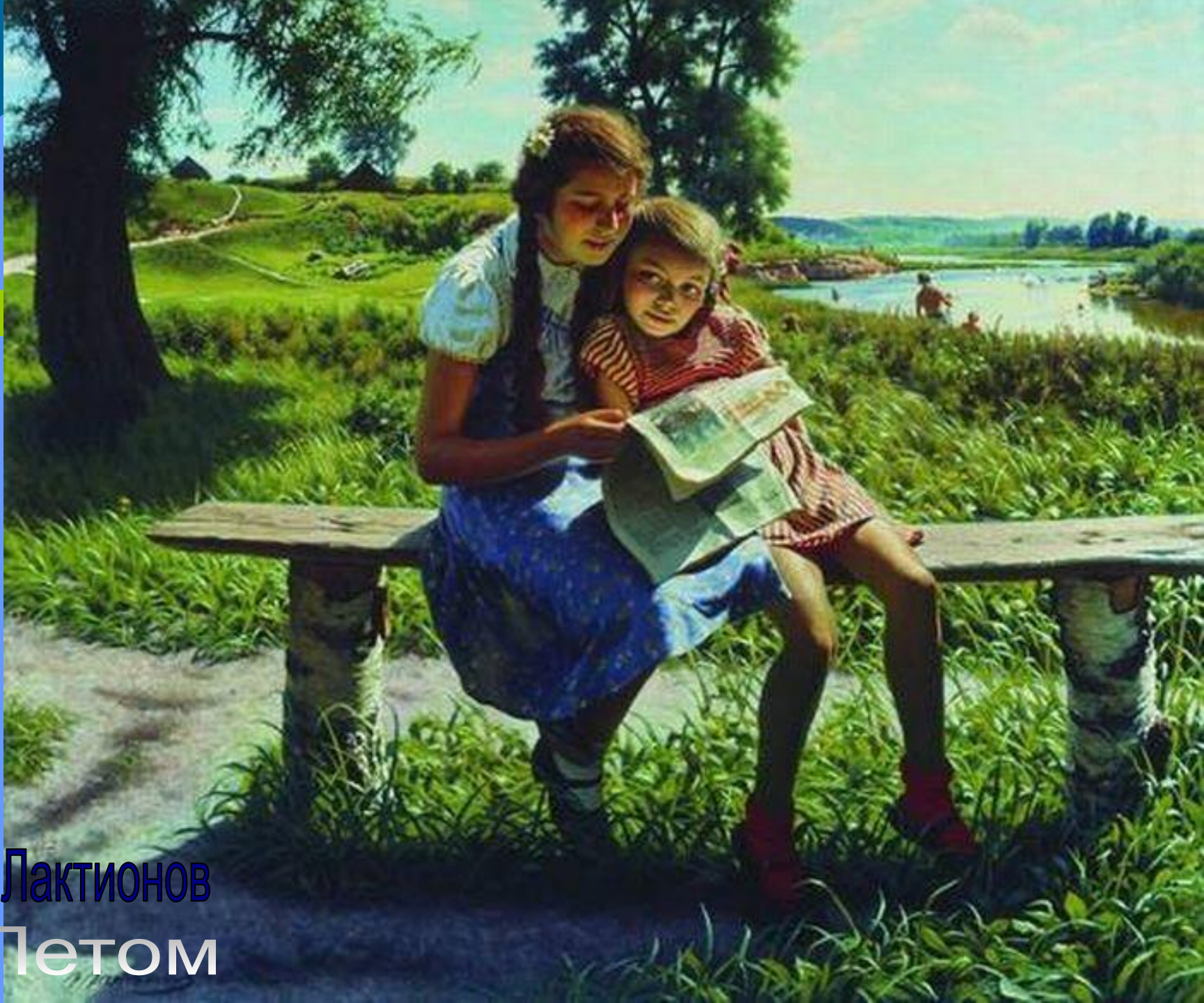
А. И. Лактионов Летом