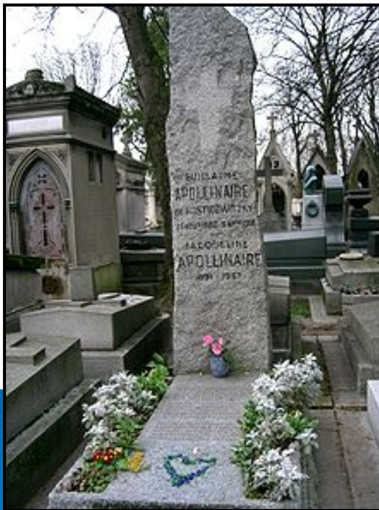
Могилa Аполлинера на кладбище Пер-Лашез