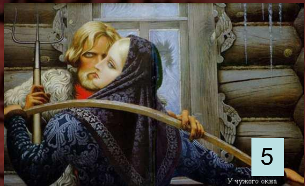
У чужого окна